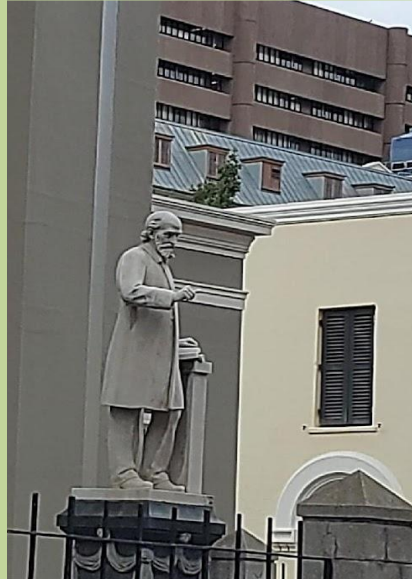
Памятник Андрею Мюррею