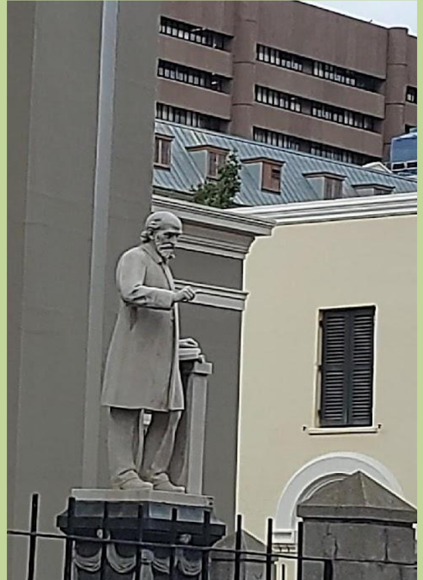
Памятник Андрею Мюррею