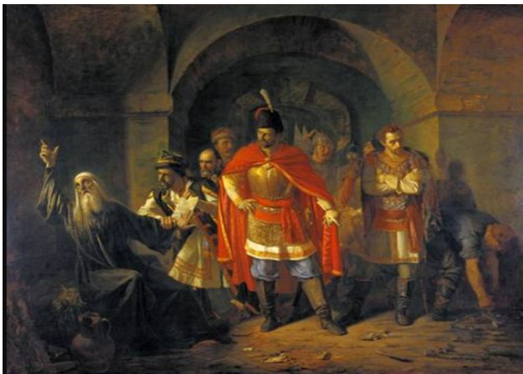
Патриарх Гермоген отказывает полякам подписать грамоту. Худ. П. Чистяков

Патриарх Гермоген отказался признать Владислава царем и запретил москвичам присягать ему.