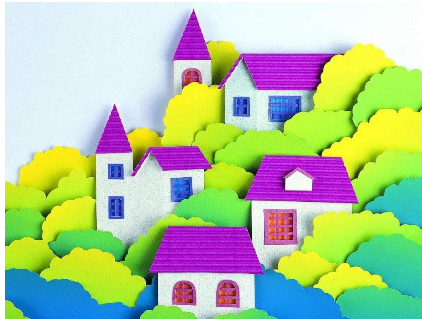
Панно из бумаги и картона