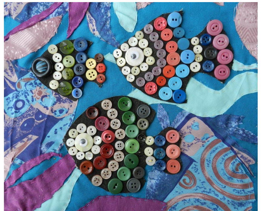
Панно с применением различных материалов