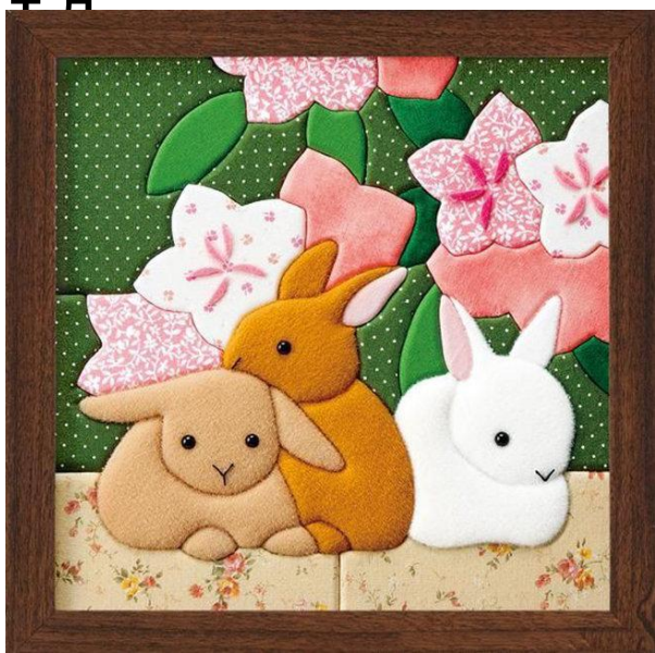
Панно-аппликация из ткани в стиле пэчворк

Аппликация. Аппликация (от лат. «прикладывание») — интересный вид художественной деятельности — это способ работы с цветными кусочками различных материалов: бумаги, ткани, кожи и т.д. Аппликация бывает разная: объемная, орнаментальная сегментная и