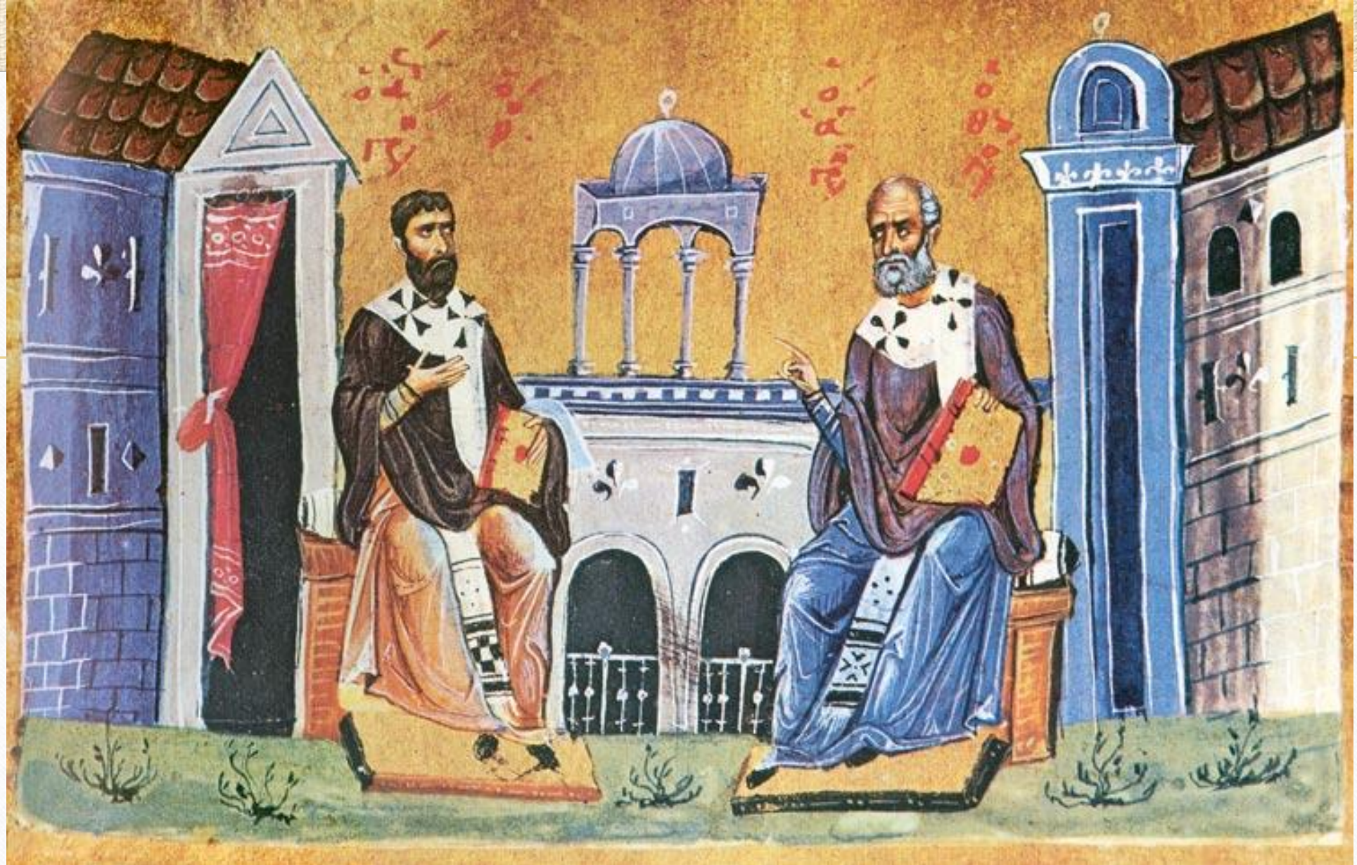
Гр. Нисс. и Гр. Богосл. Миниатюра. XI в. (Dionys. 61. Fol. 113r)