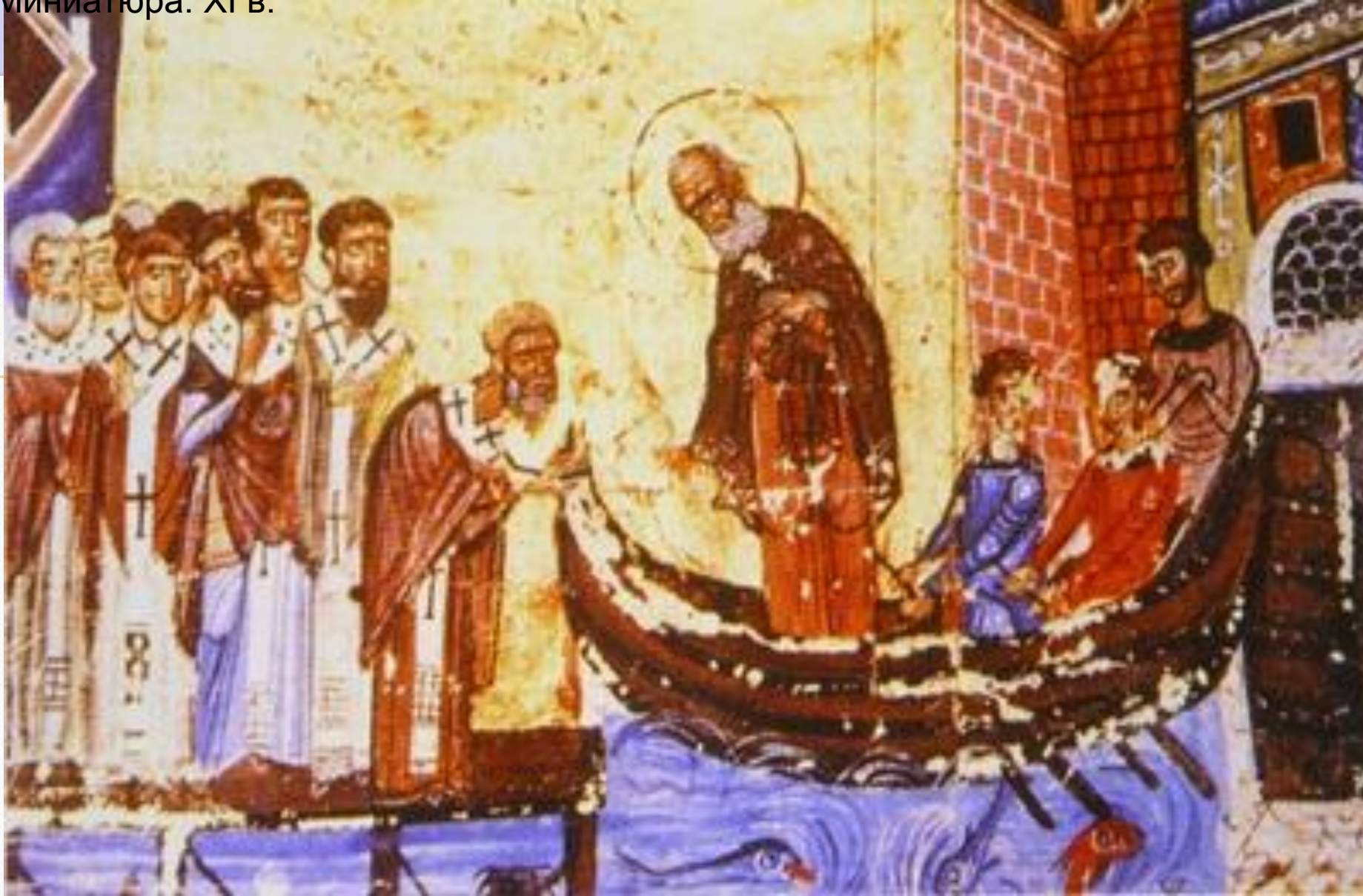
Отплытие из Константинополя. Миниатюра. XI в.