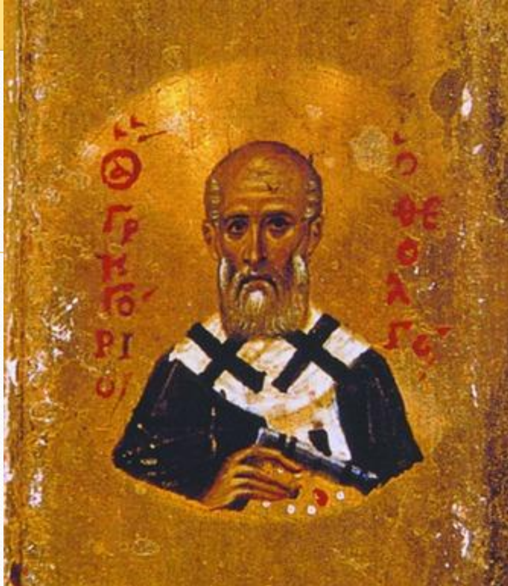
Синай, XI-XII вв.