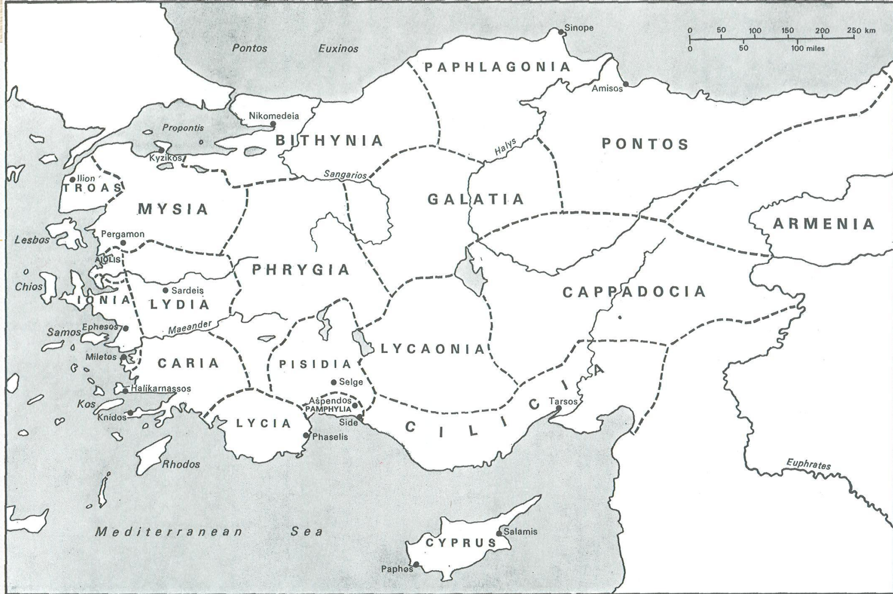
MAP 14 ASIA MINOR