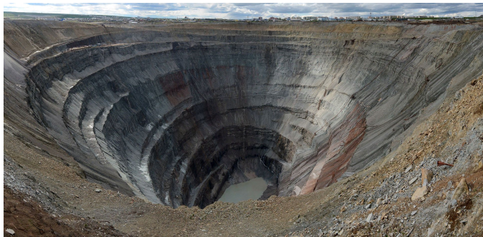
Кимберлитовая трубка «Мир»