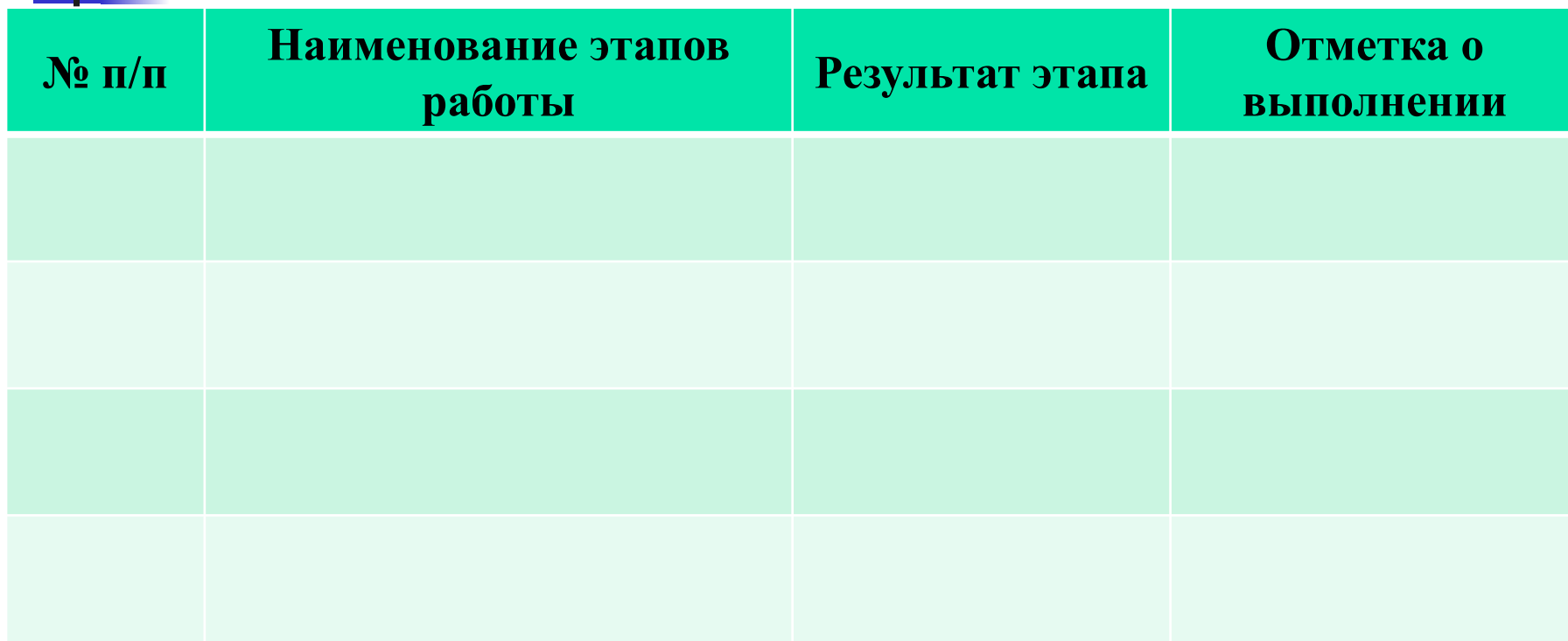
Таблица отчета по УИРС за ____ семестр