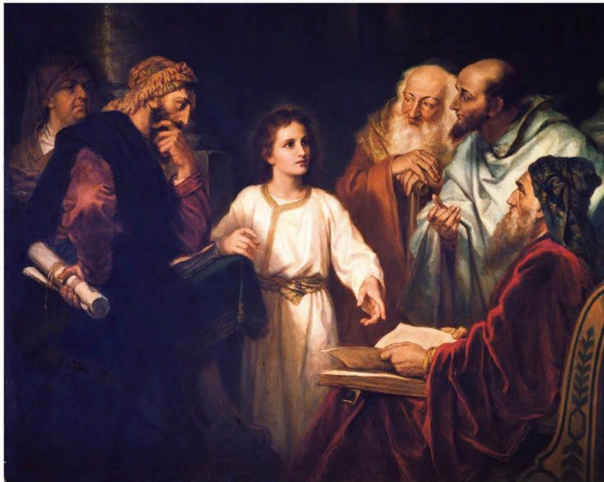
Christ in the Temple, by Heinrich Hofmann