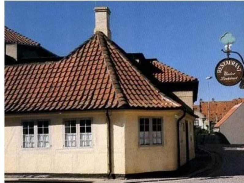
Домик в Оденсе, где родился сказочник