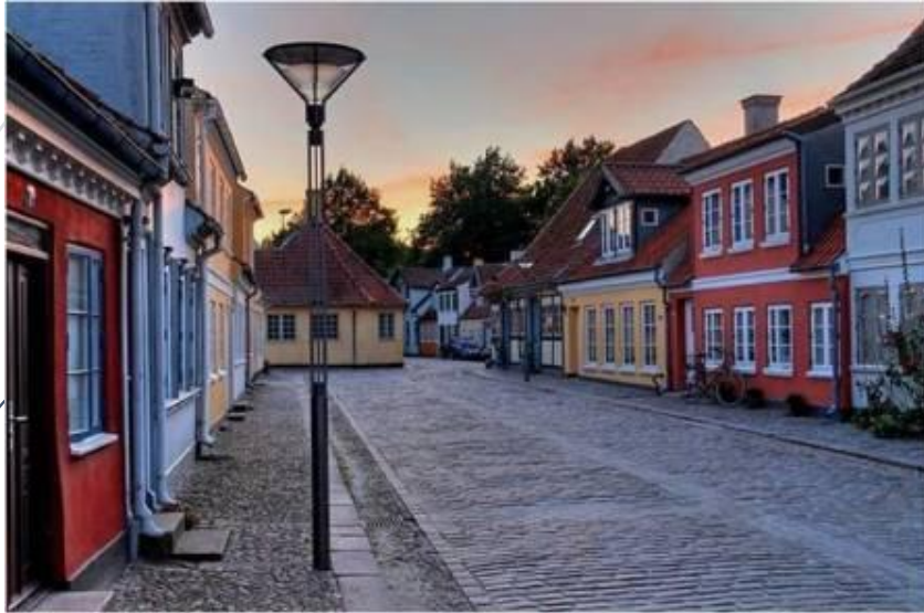
Оденсе. Родная улица Г.Х. Андерсена

В Дании есть маленький остров Фюн, а на нем город Оденсе, здесь в 1805 году и родился будущий знаменитый