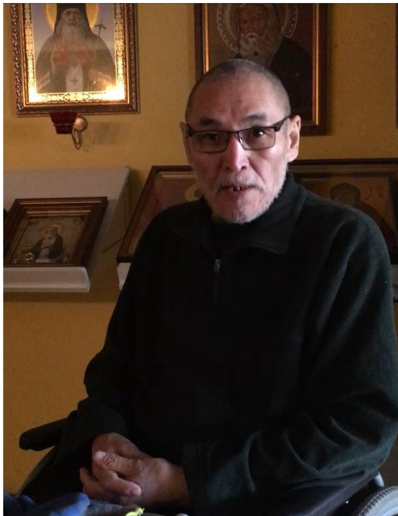
Соломон - церковное имя

Родился в 1965 г. в с.Шибертуй Бичурского района. Женат, имеет двоих взрослых детей.