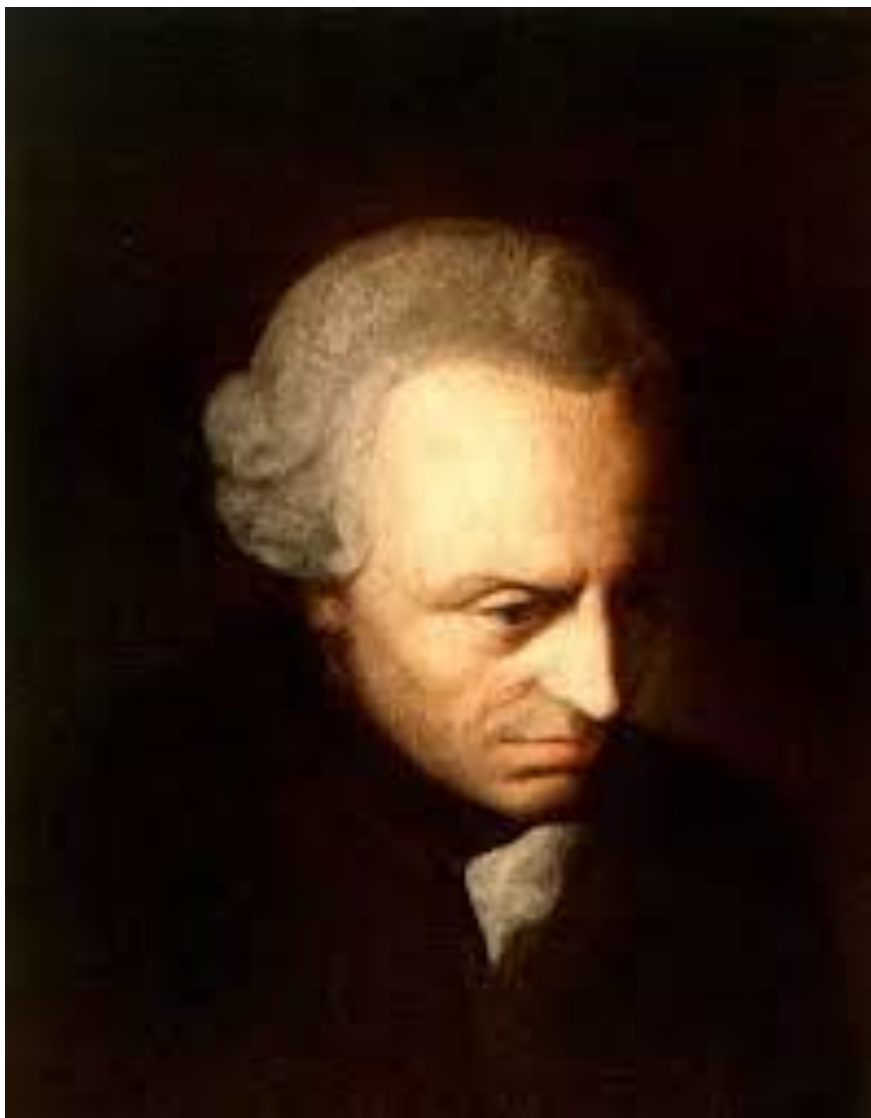
Иммануил Кант (1724 –1804)

«Категорический императив» (повеление): поступай всегда согласно такой максиме (правилу), которую ты хотел бы сделать обязательной для всех людей.