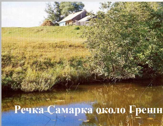
Речка-Самарка около Грешнева

Николаю не разрешали дружить с детьми крепостных крестьян. Но, улучшив удобную минуту, мальчик убегал через лазейку к своим деревенским друзьям, уходил с ними в лес, купался в речке Самарке. Этот момент его жизни — непосредственное общение с крестьянскими детьми - оказал влияние на его творчество.