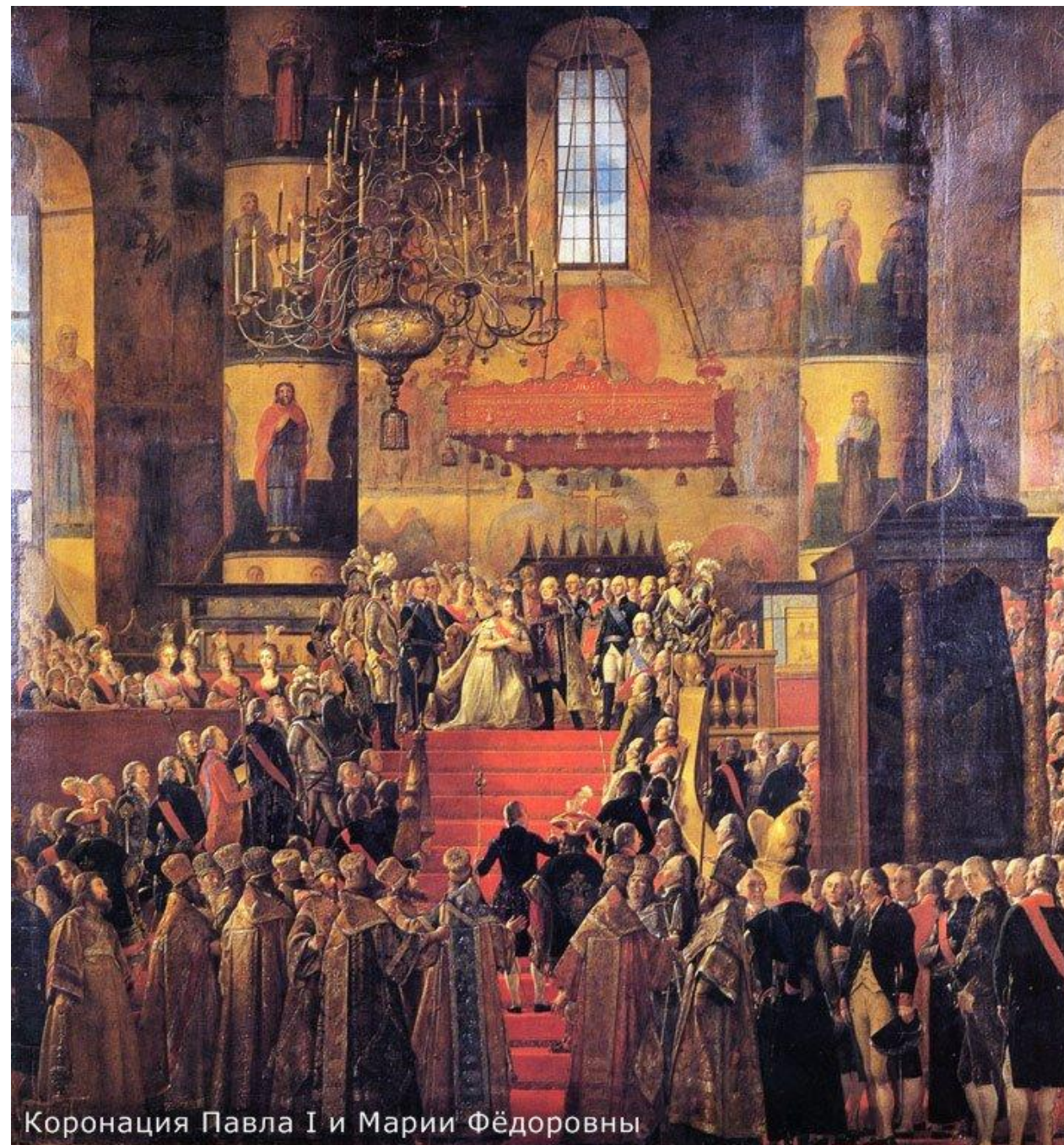
Коронация Павла I и Марии Фёдоровны

Павел Петрович – император- первосвященник: попытка сакрализовать государство