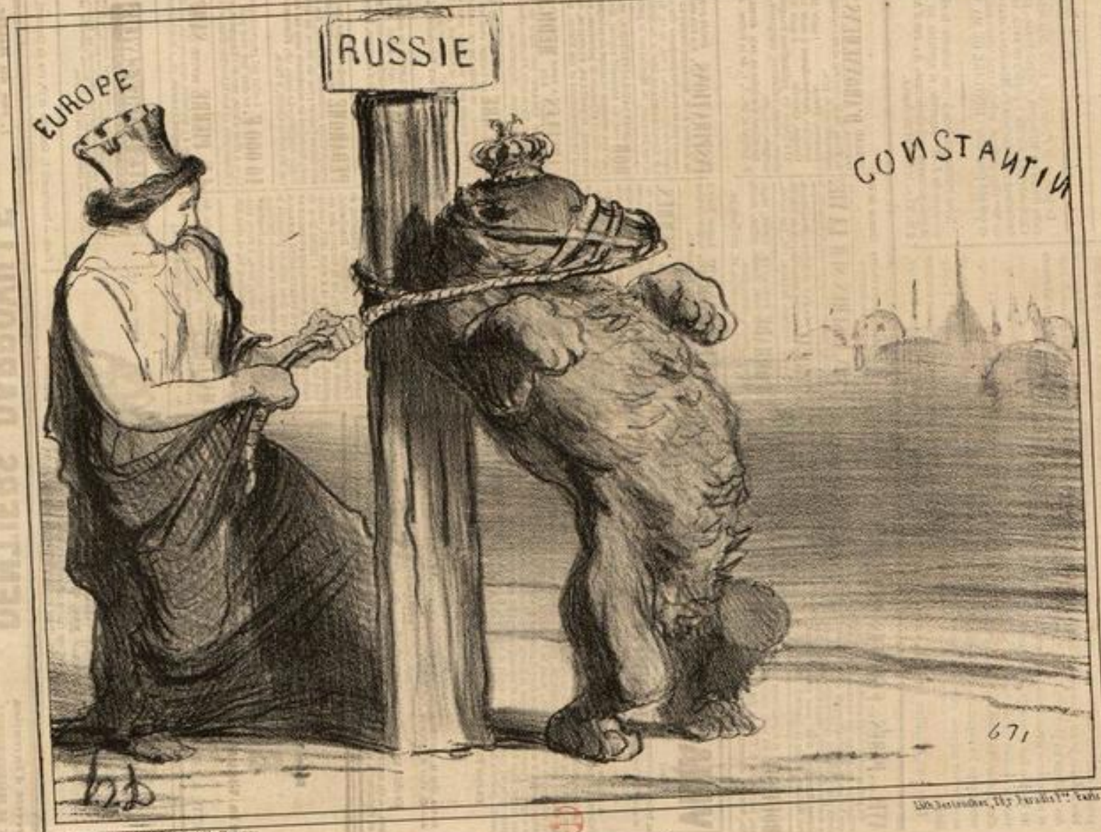
Un ours contrarié.