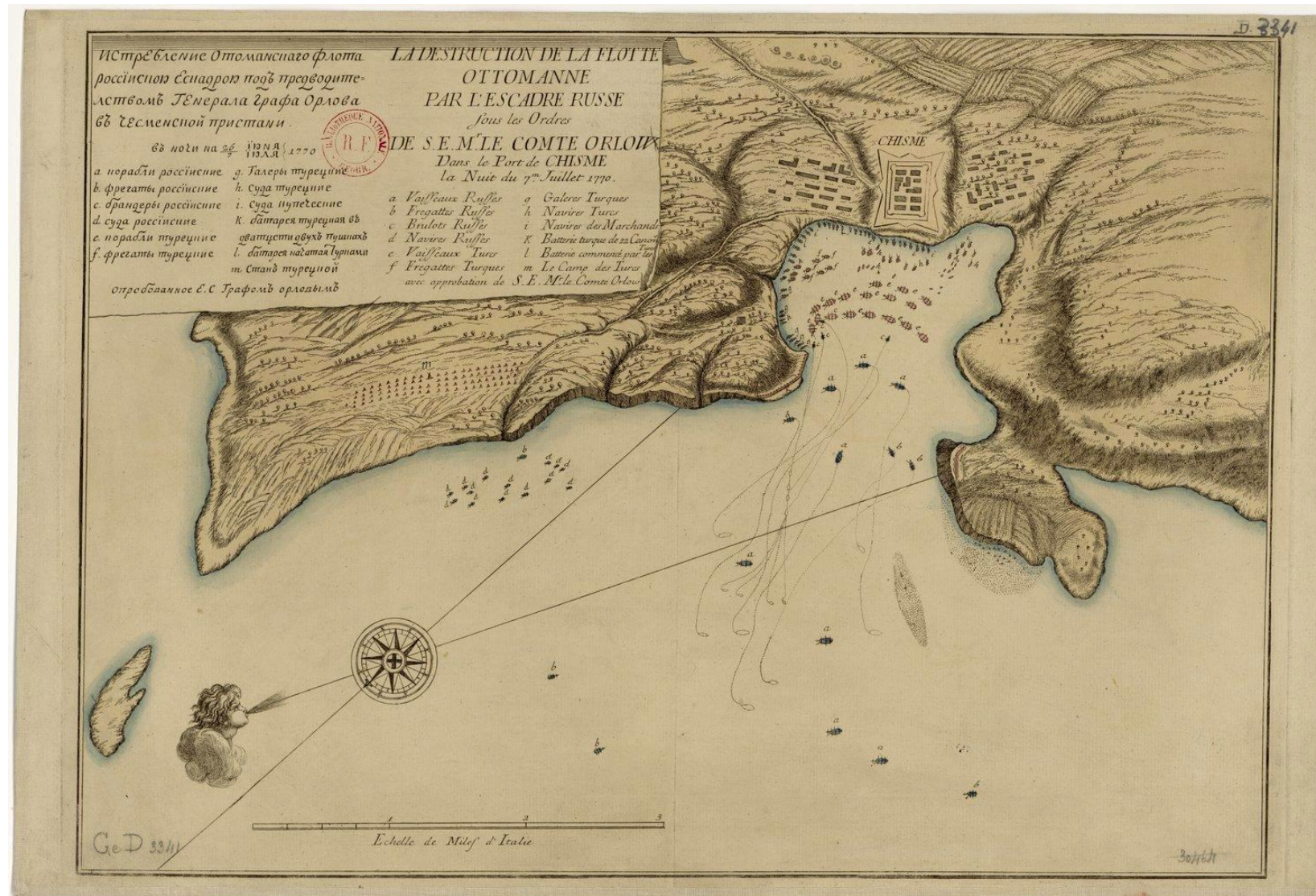
Разгром османского флота русской эскадрой при Чесме. Париж, XVIII век

Екатерина II вынашивала план покорения Османской империи и освобождения греческого народа от турецкого ига. При этом она не планировала присоединять завоеванные земли к России. Ее целью было основание нового грандиозного православного государства со столицей в Константинополе, возглавить которое должен был ее внук — Константин Павлович. Его старшему брату Александру, в чьем имени соединились Александры Македонский и Невский, предназначался