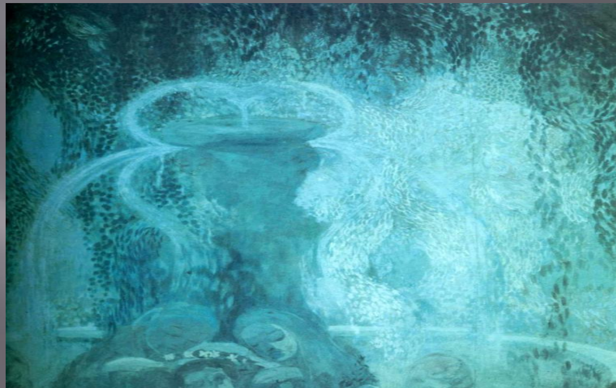
Голубой Павел Варфоломеевич Кузнецов