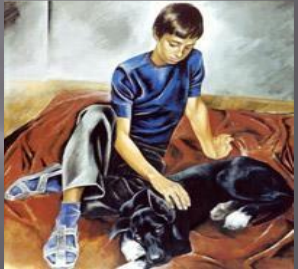
Мальчишк Картина И. Ф. П. Решетникова