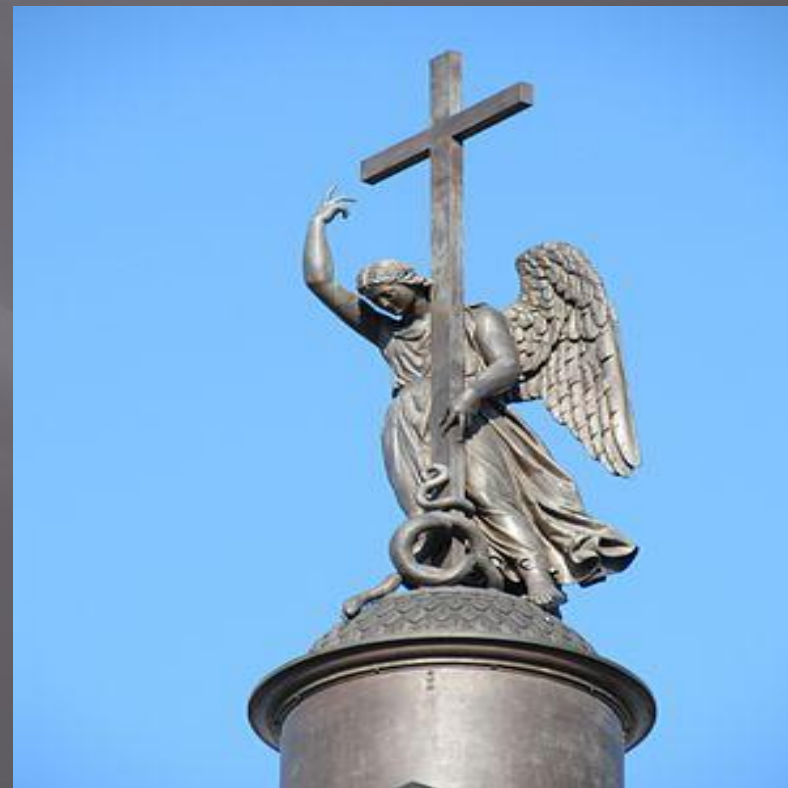
Скульптура ангела на цилиндрическом