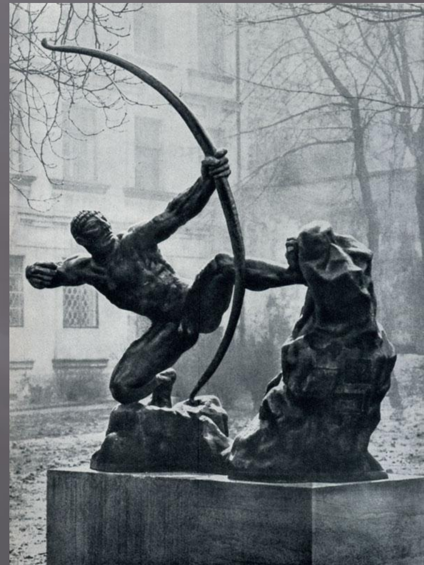
• Стреляющий геракл