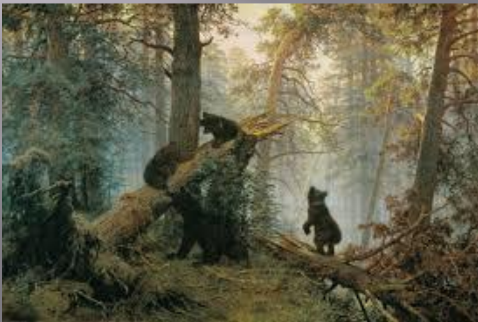
“Утро в сосновом лесу” (1889)год -картина русских художников Ивана Шишкина и Константина Сивицкого.