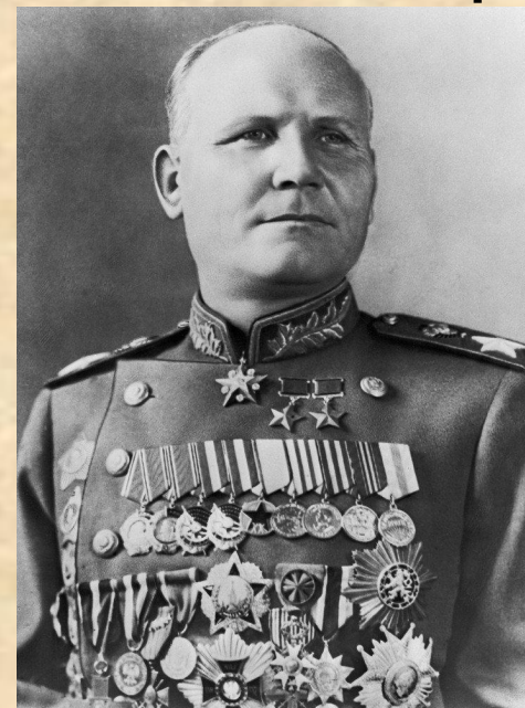
Иван Степанович Конев, командующий 1-м Украинским фронтом Берлинской операции. Маршал, дважды Герой Советского Союза