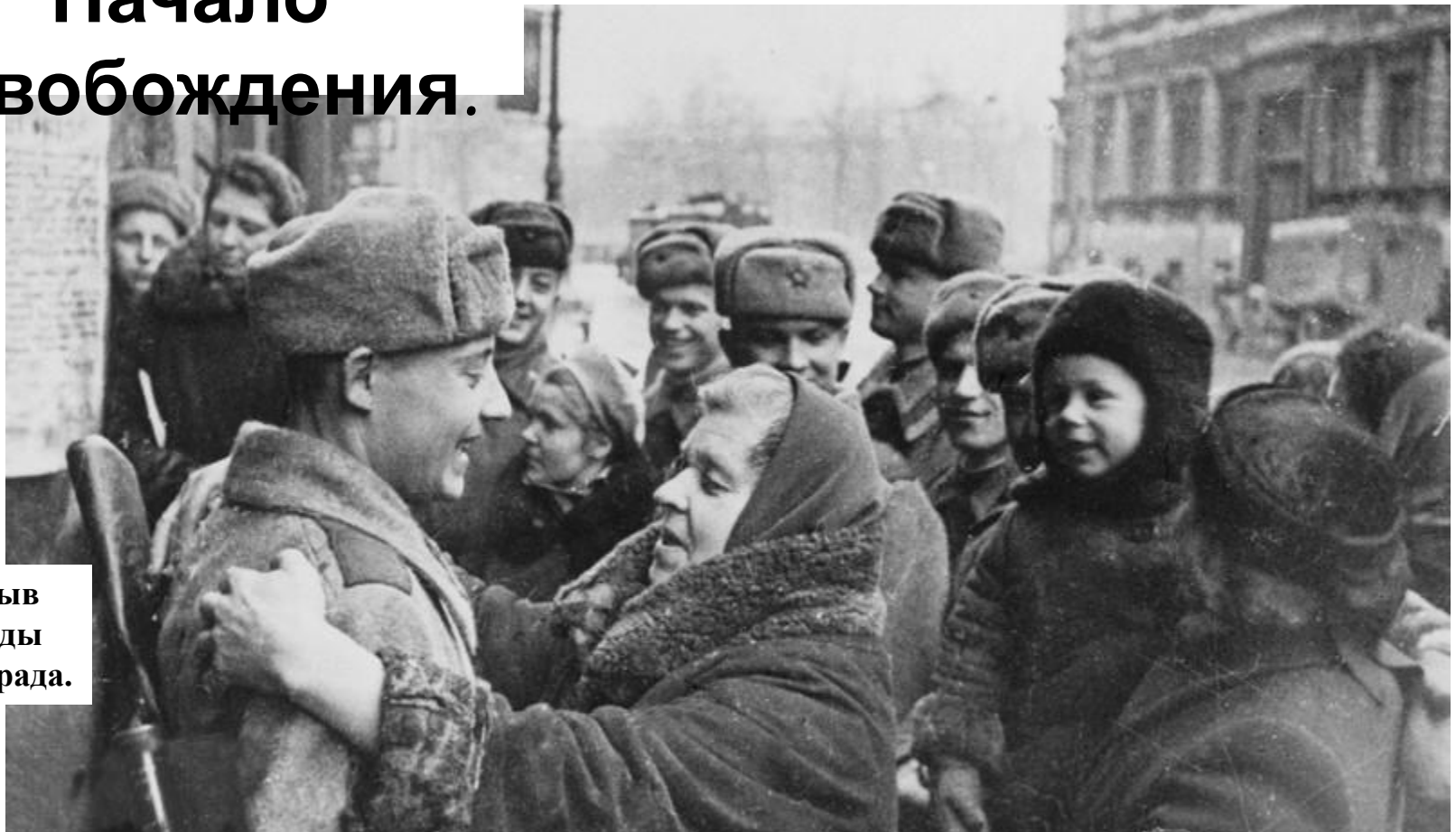
Прорыв блокады Ленинграда.

18 января войска Ленинградского и Волховского фронтов сумели частично прорвать блокаду города. В феврале началось освобождение Донбасса. Воронежский фронт разгромил 3 немецких армии и глубоко вторгся в немецкие позиции образовав Курскую Дугу. Всего в ходе зимнего наступления советские войска разгромили более 100 немецких дивизий. Закончилась битва За Кавказ.