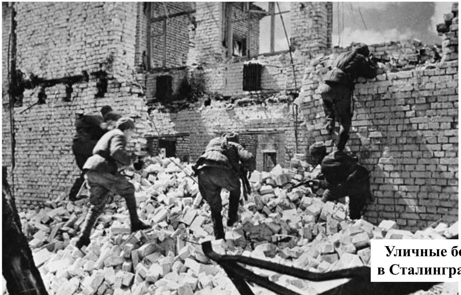
Уличные бои в Сталинграде.

В октябре Жуков и Василевский разработали План контрудара под Сталинградом- «Уран». К югу и к северу от города были тайно переброшены многочисленные резервы