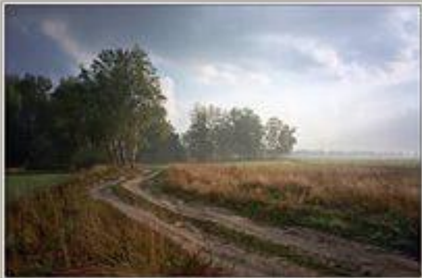
Over the Hill