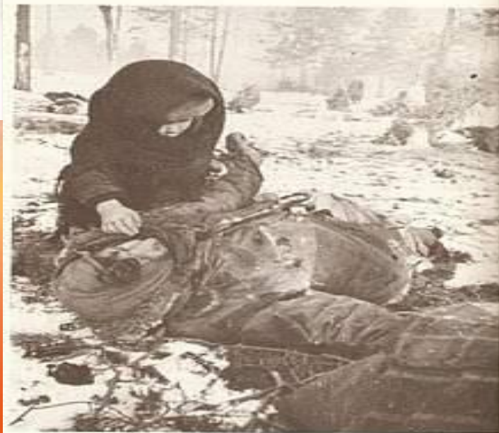
Ein Kind an der Leiche seiner Mutter, umgekommen in einem KZ für Zivilisten, 1944, der Ortsteil Oberteich.