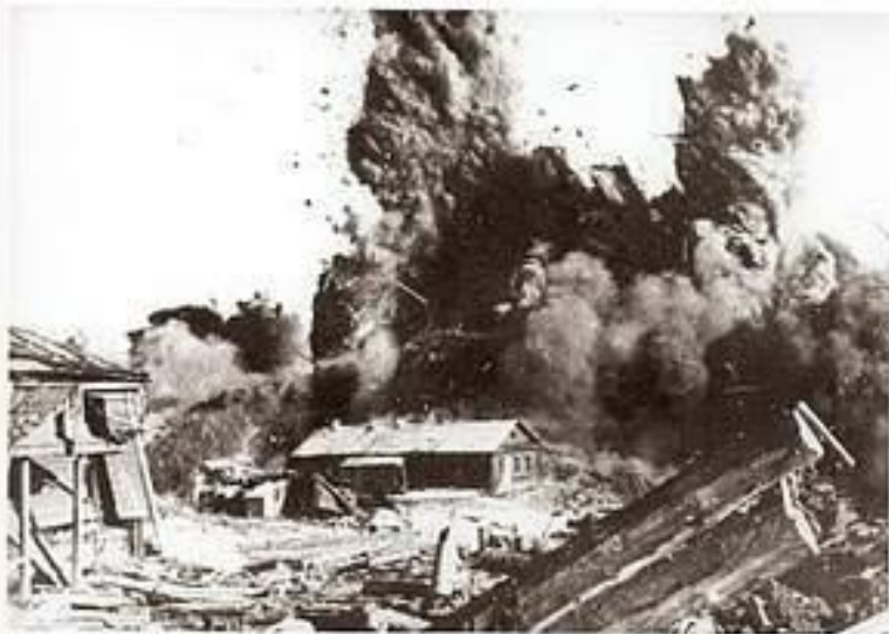
119. Jünglingsdorf Zerstörung des Dorfes Mikawa, 1944