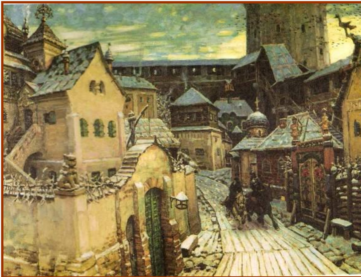
А. Васнецов. Гонцы. Ранним утром в Кремле.