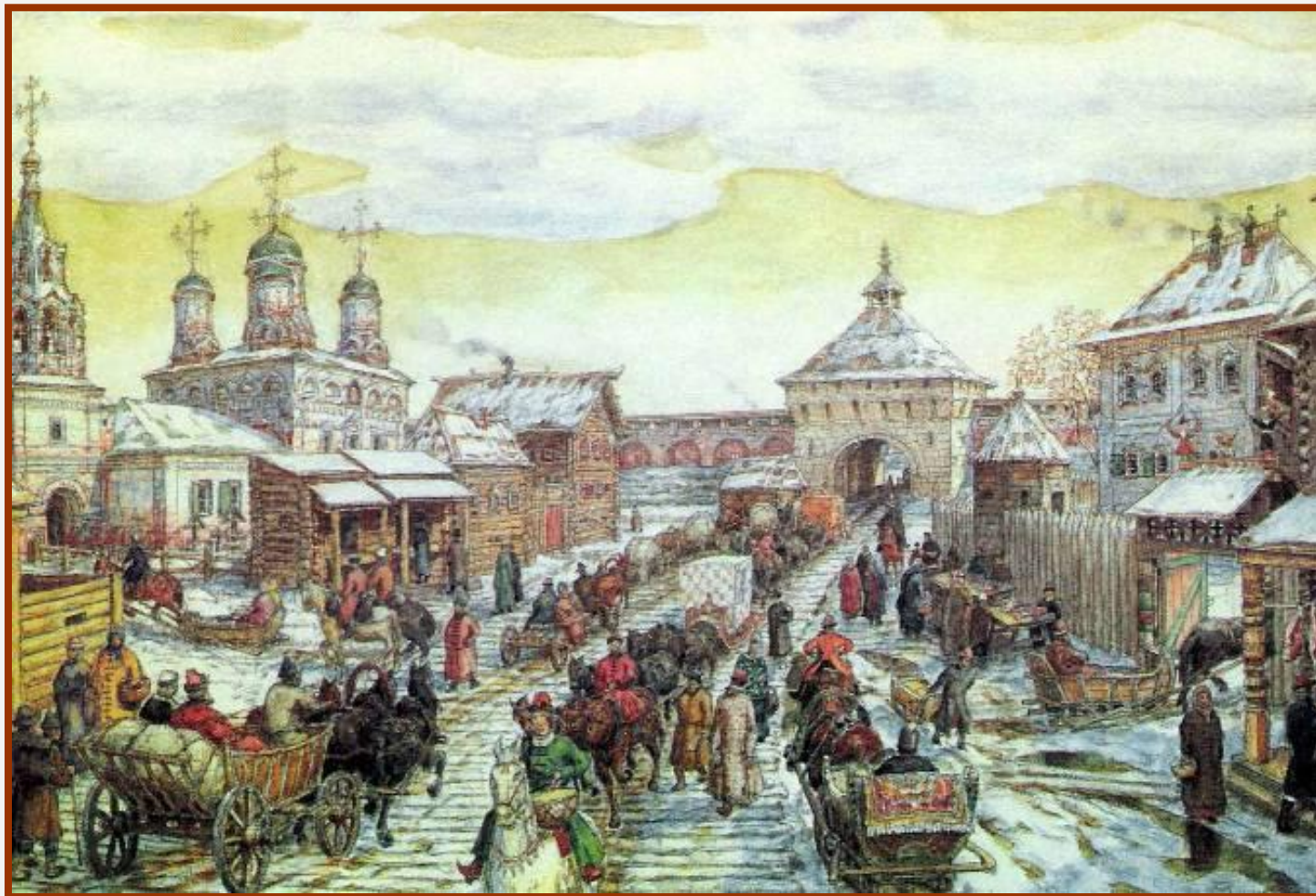
А. Васнецов. Мясницкие ворота. Уличное движение в XVII веке