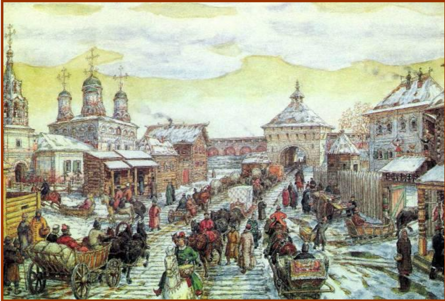
А. Васнецов. Мясницкие ворота. Уличное движение в XVII веке