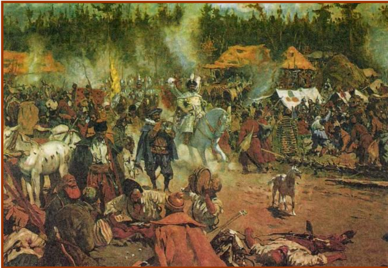
С. Иванов. Смутное время