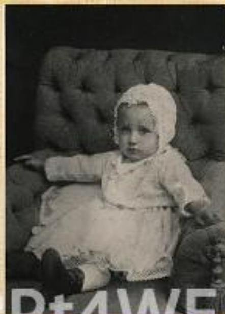
А. Ахматова в детстве