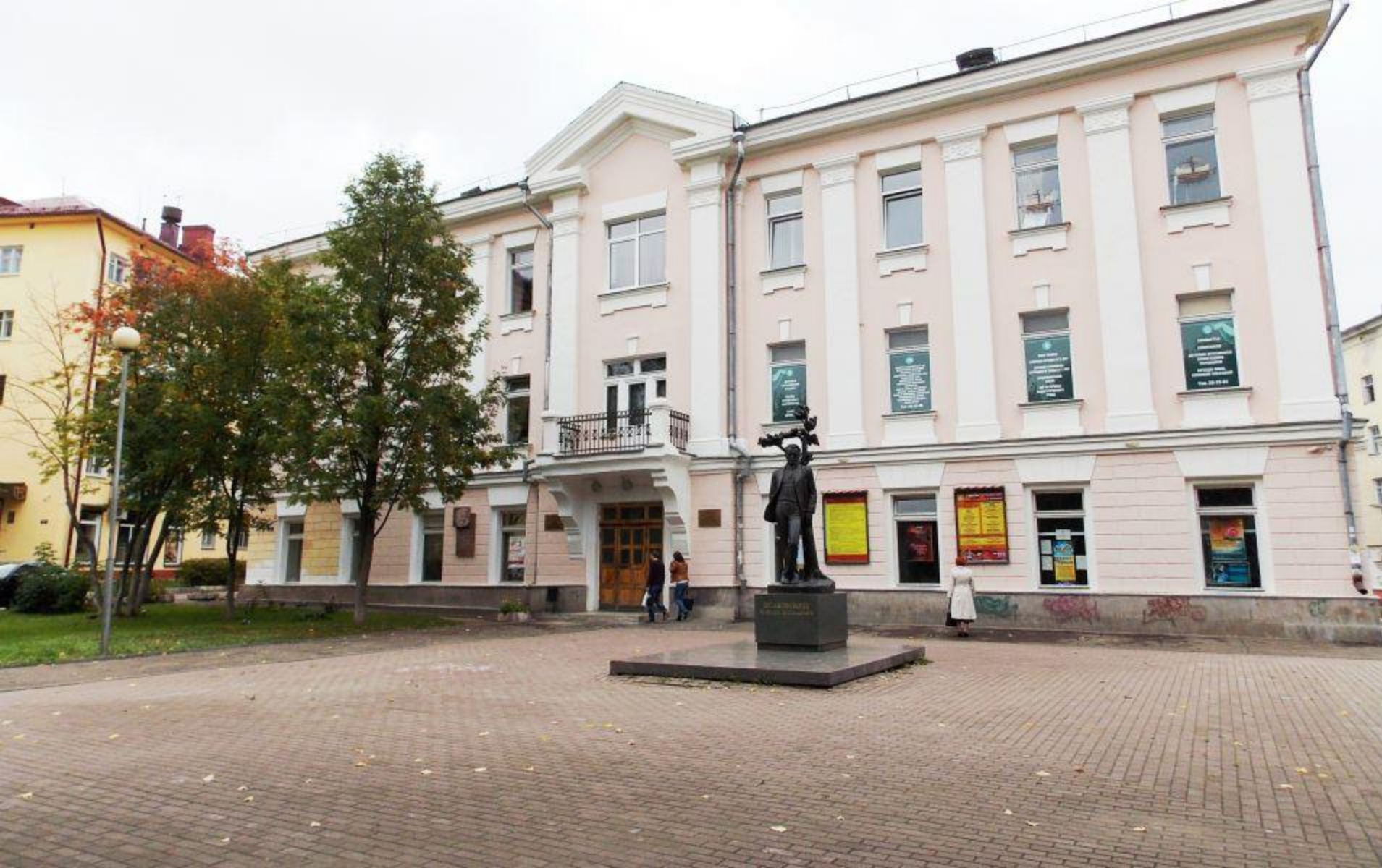
Этот памятник расположен в Смоленске