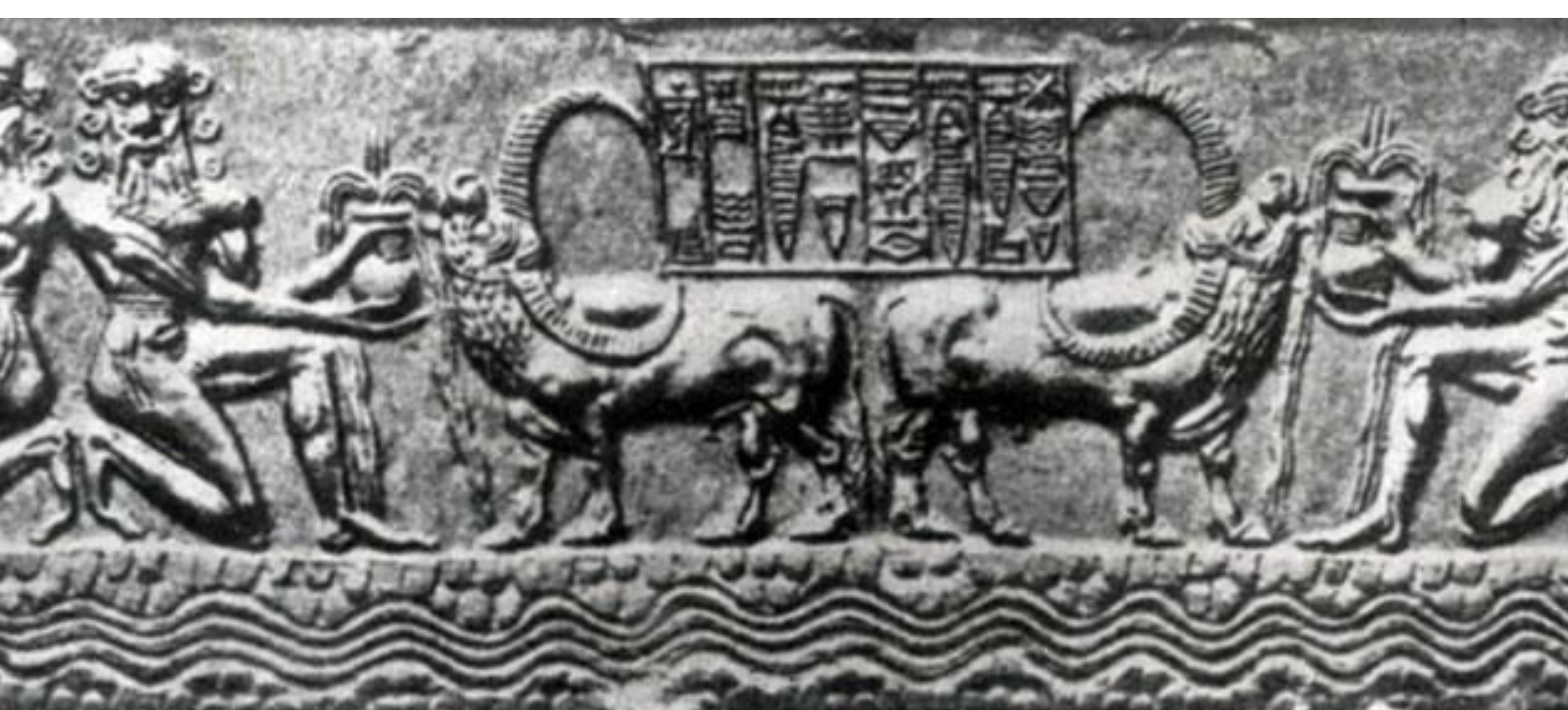
Водопой. Цилиндрическая печать из Аккада. Середина 23 в. до н. э. Собр. де Клерк (Франция)