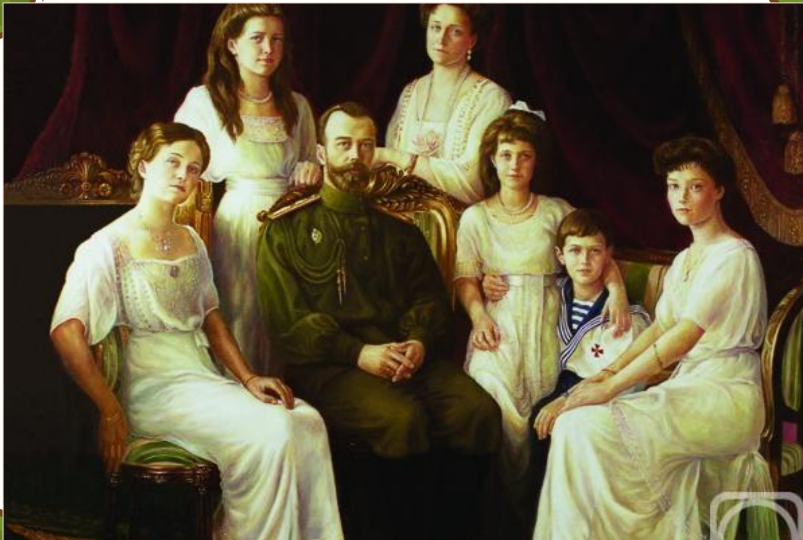
Ирина. г Семьи императора я II