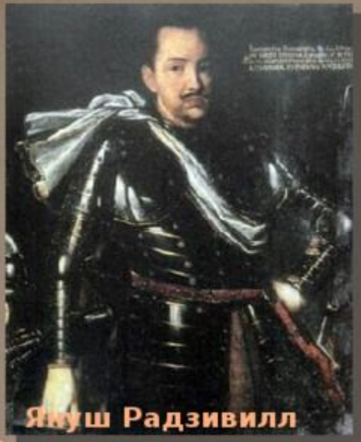
Януш Радзивилл Радзивилл