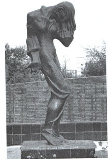
Памятник-ансамбль жертвам политических репрессий в г. Абакане. Автор В. Кученов

Посвящается жертвам политических репрессий Республики Хакасия