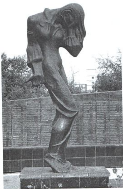
Памятник-ансамбль жертвам политических репрессий в г. Абакане. Автор В. Кученов

Посвящается жертвам политических репрессий Республики Хакасия