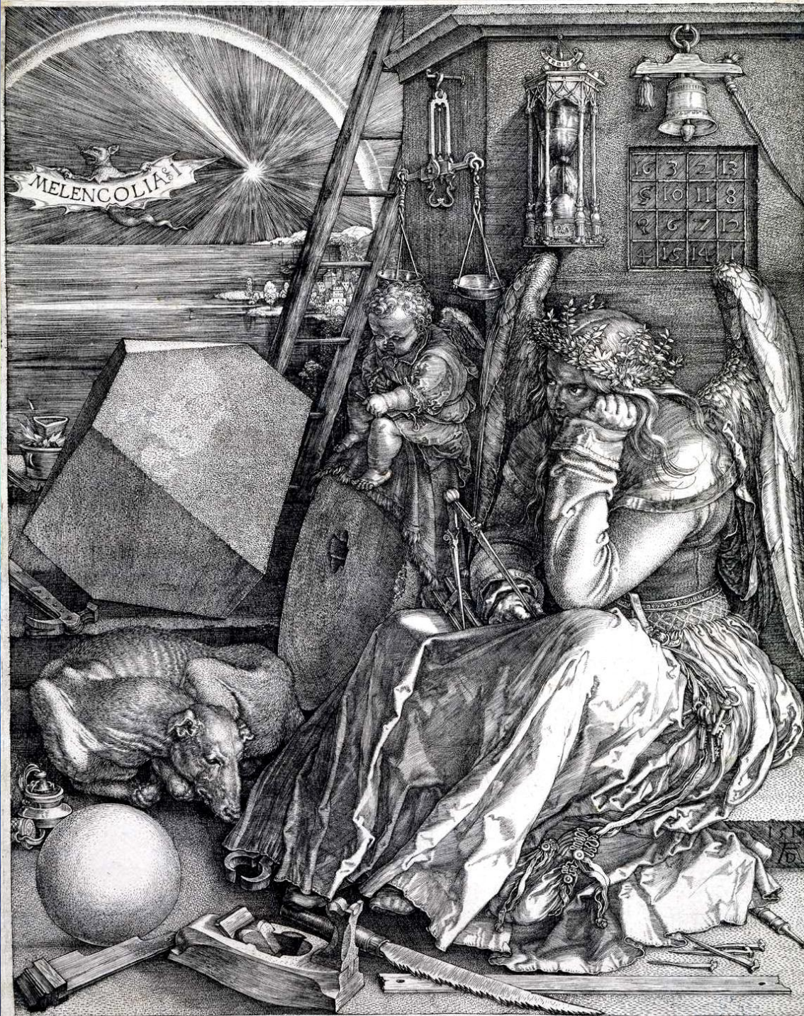
Гравюра Альбрехта Дюрера «Меланхолия»