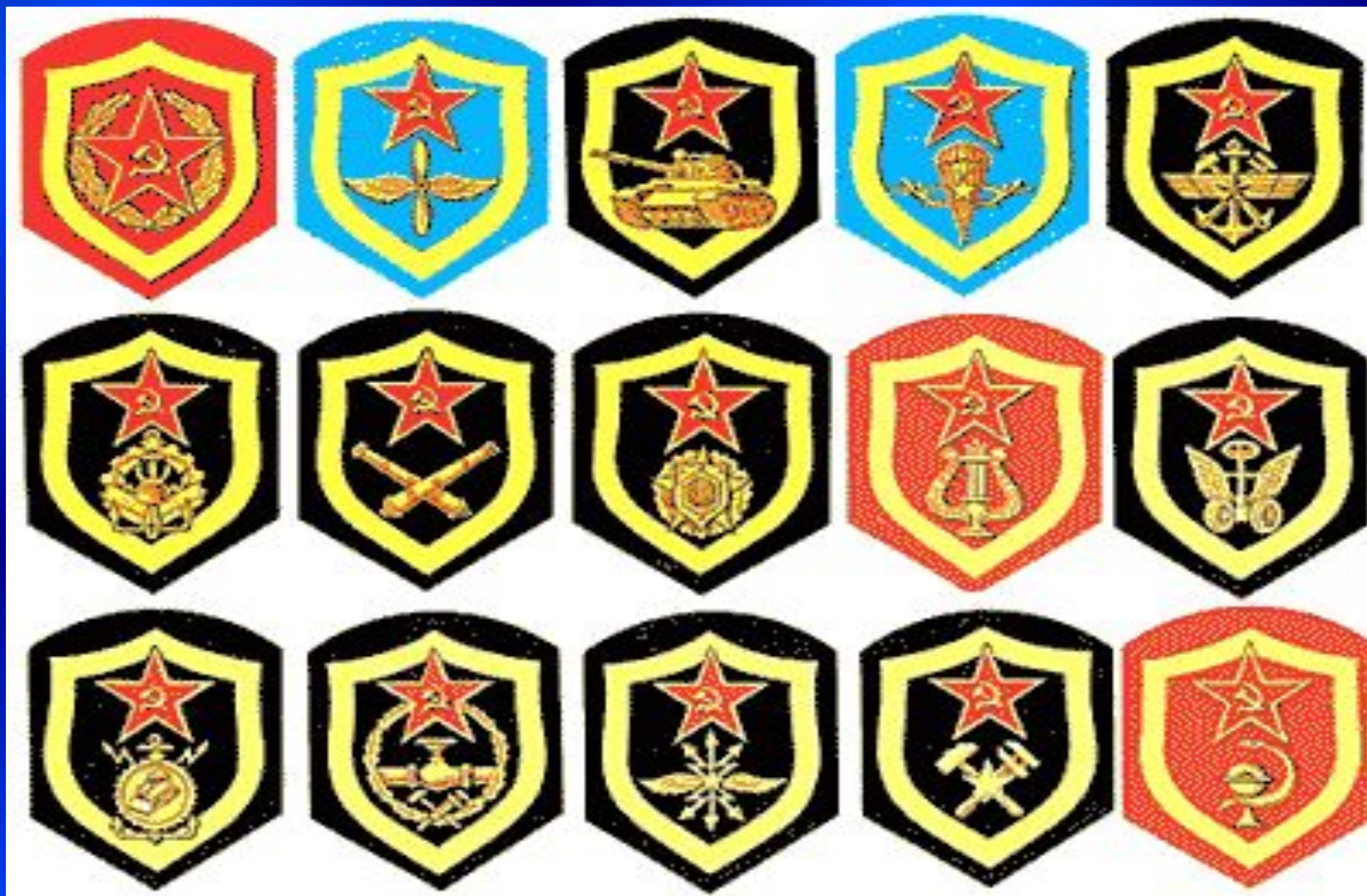
Эмблемы различных родов войск