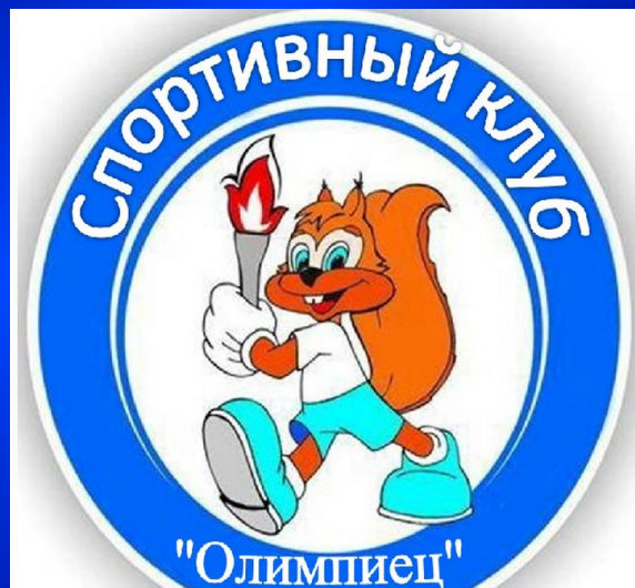
эмблема спортивного клуба