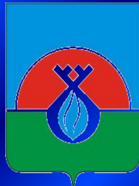
Герб города Надым