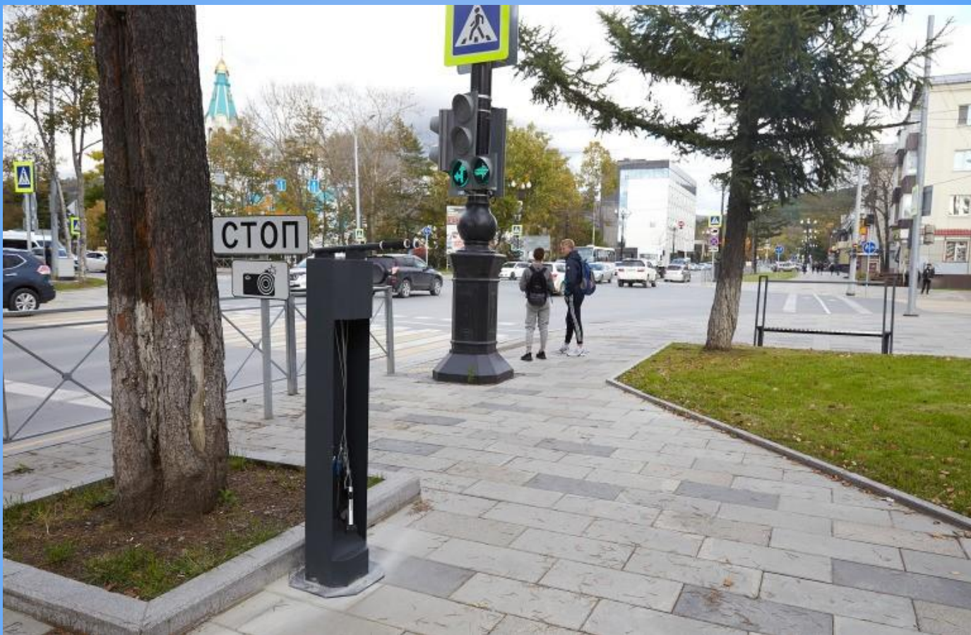
Велосипедная станция в Южно-Сахалинске на пересечении улиц Коммунистический проспект и Комсомольская.