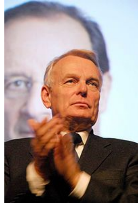
Від 15 травня 2012 року уряд Франції очолює Жан-Марк Еро.