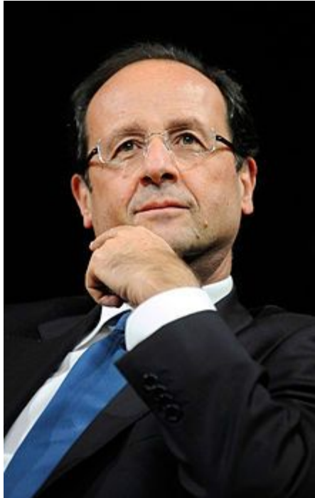
Президент Франції Франсуа Олланд (з 2012 р.)