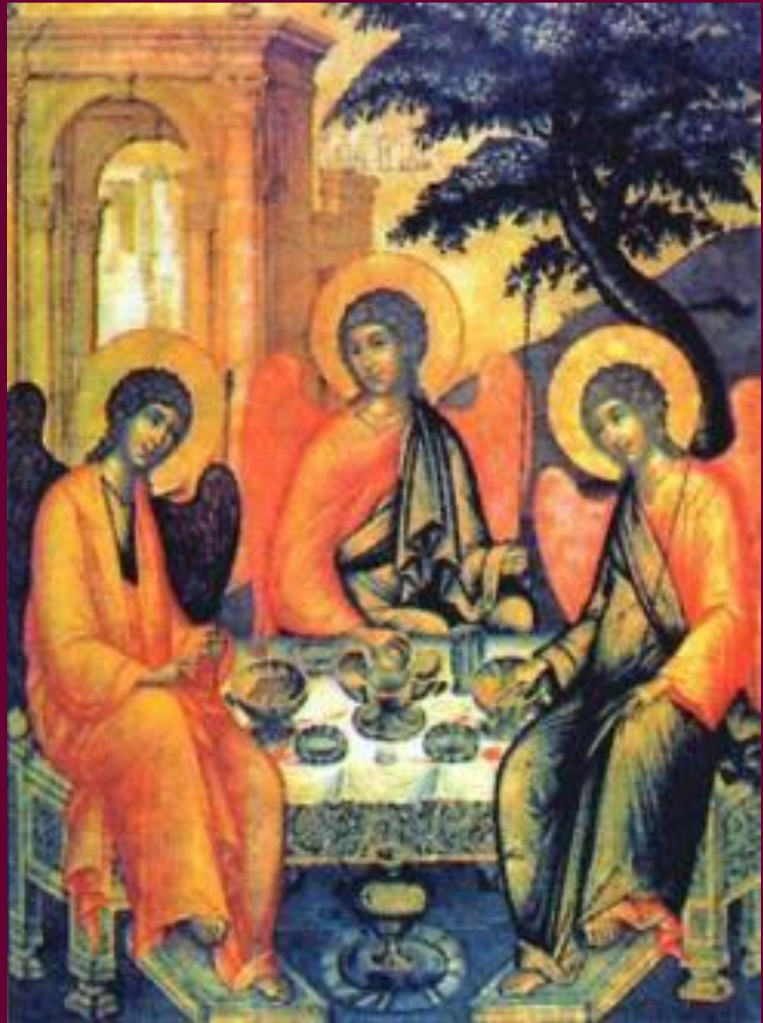
Симон Ушаков. «Троица»

Основным видом живописи продолжала оставаться иконопись .