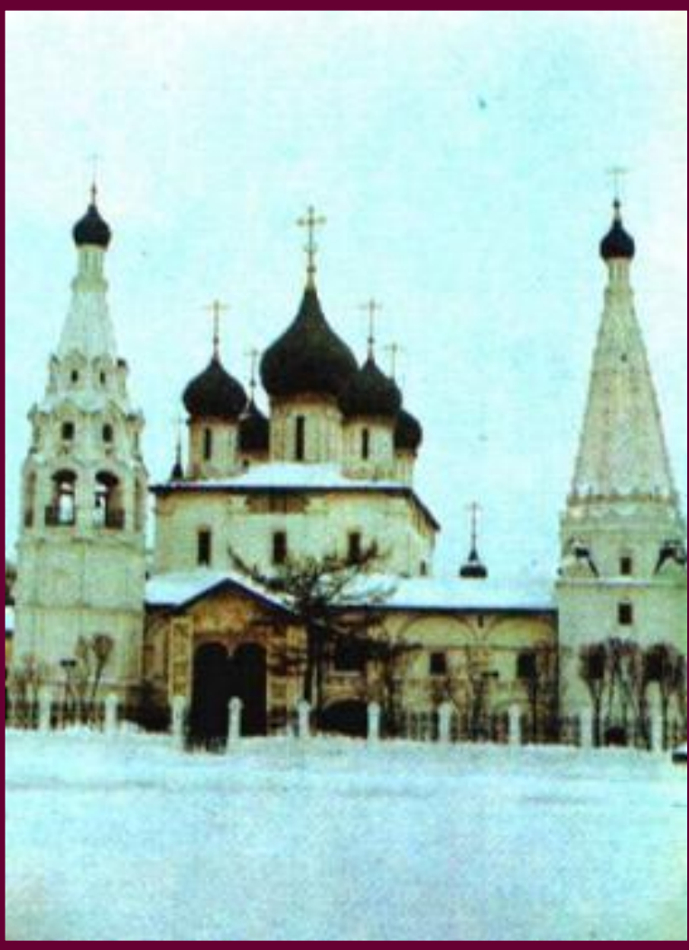
Церковь Ильи Пророка в Ярославле

В архитектуре 17 века наблюдается отход от строгих церковных правил. В частности, появляется т.н.