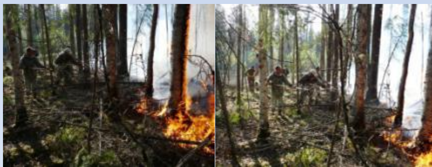
Добровольная пожарная дружина на тушении лесного пожара. Среди добровольцев родители юных лесничих.