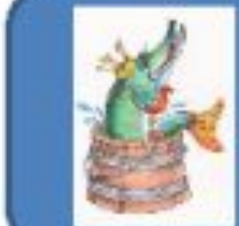
№1. Начало реки

ПРАВИЛА ПОВЕДЕНИЯ У РЕКИ: ТЫ ПРИШЁЛ - ВСЁ ЧИСТО! УХОДЯ - ОСТАВЬ ВСЁ ТАК ЖЕ!