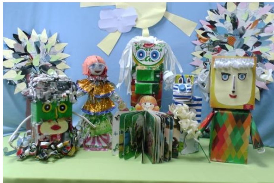
Мультфильм из макулатуры