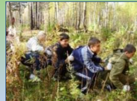
Остановка «Тропою таёжных трав»