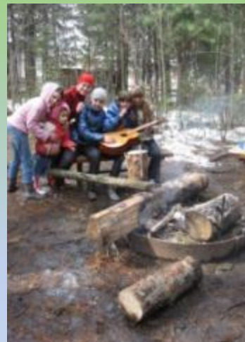
Остановка «Костер дружбы»