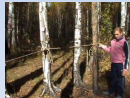
Остановка «Исследовательская» Метод пробных площадок