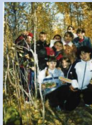
Остановка «Поляна загадок»