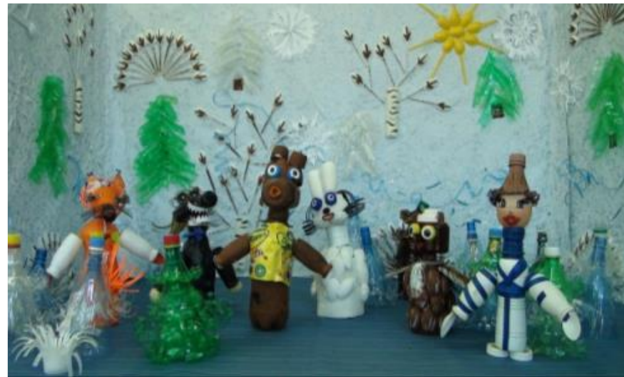
Мультфильмы из пластиковых бутылок