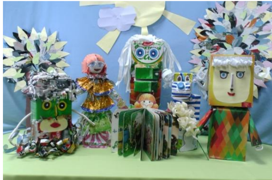
Мультфильм из макулатуры