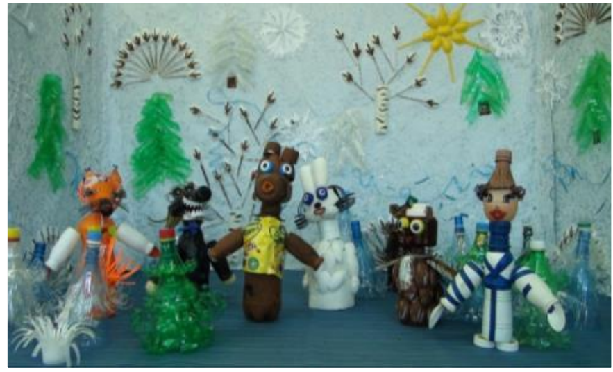
Мультфильмы из пластиковых бутылок