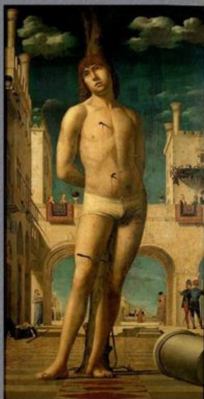
Антонелло да Мессина