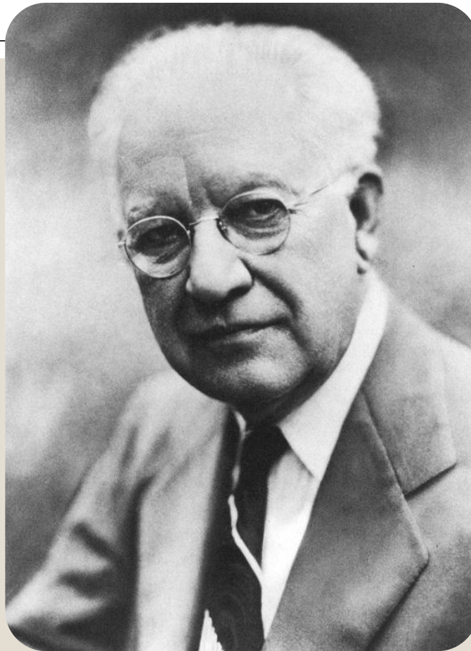
Роберт Парк 14 февраля 1864 - 7 февраля 1944 г.