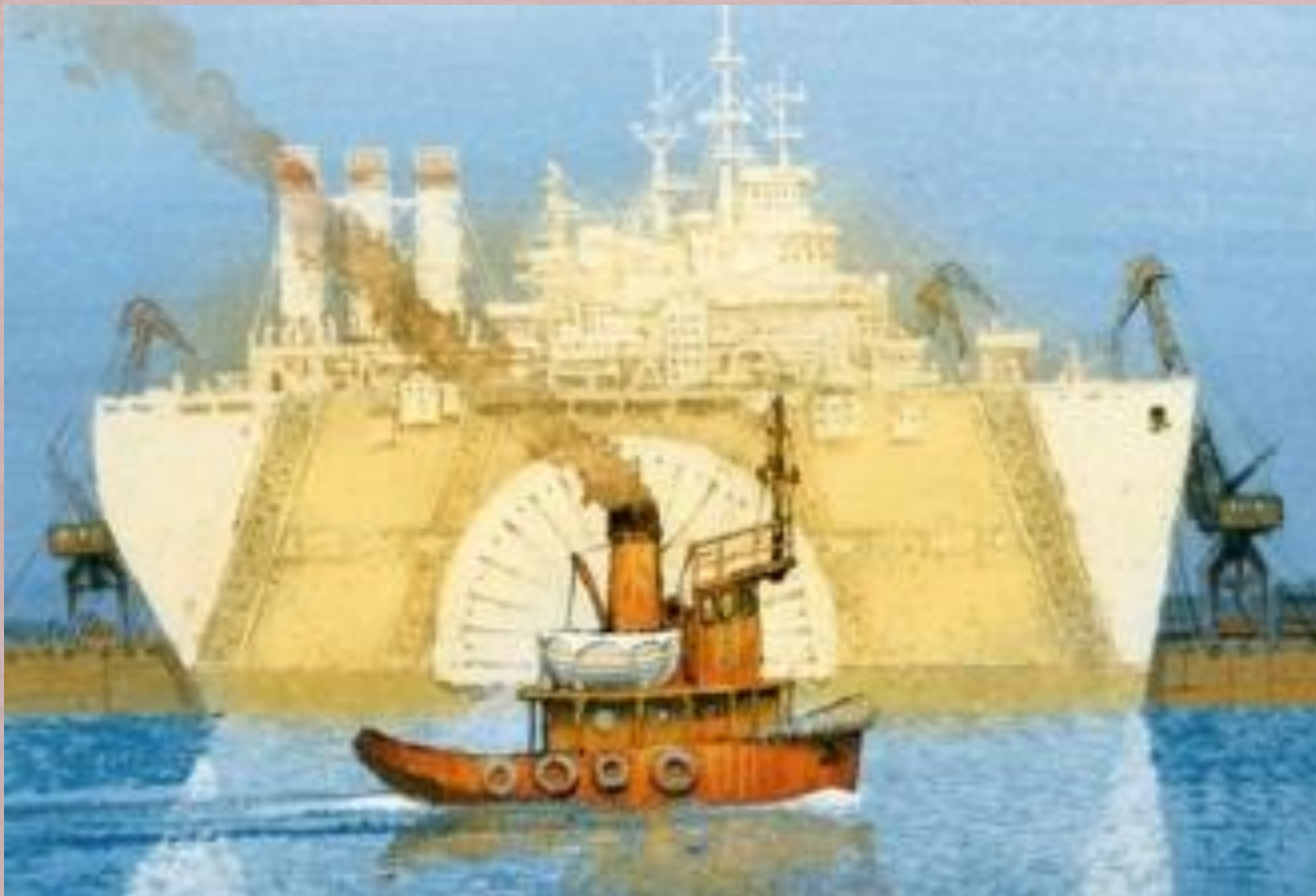
Баллада о маленьком буксире