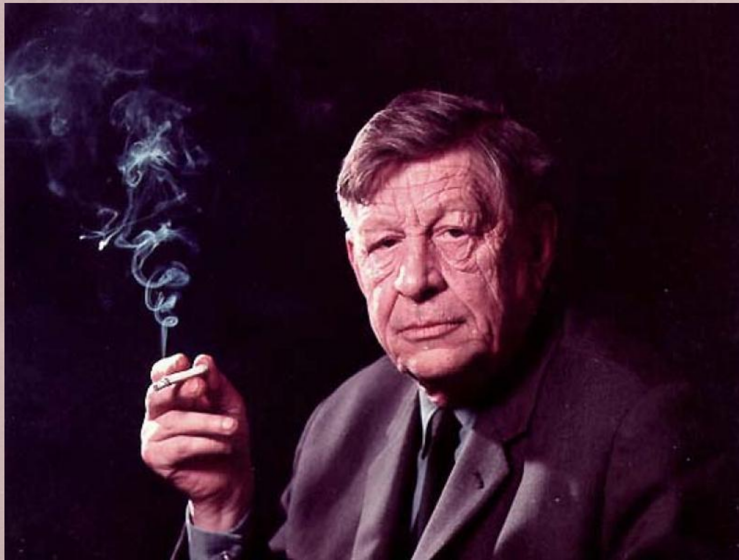
Уистен Хью Оден