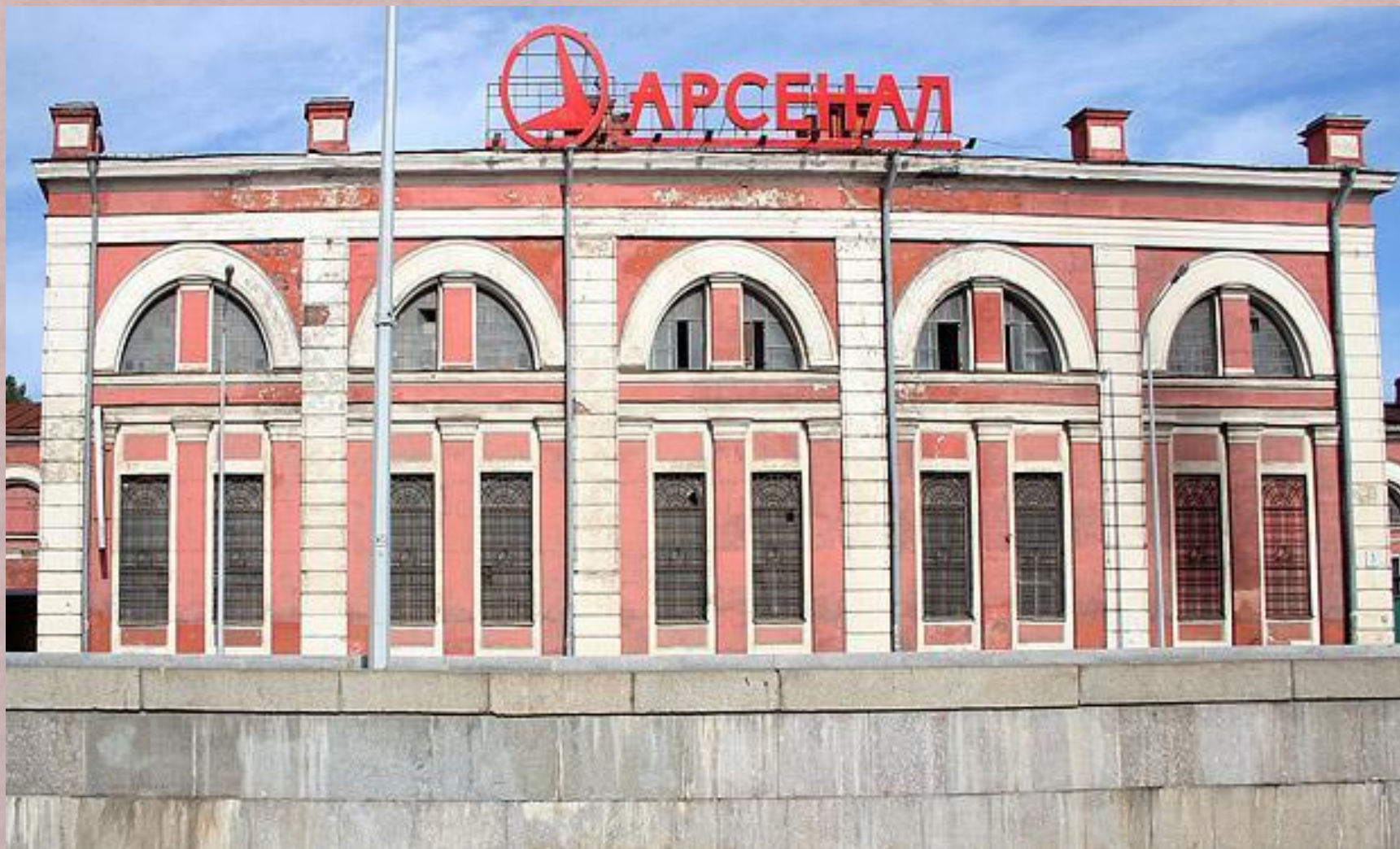
Завод "Арсенал" в наши дни