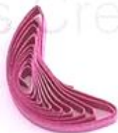
изогнутый полукруг (месяц, полумесяц)