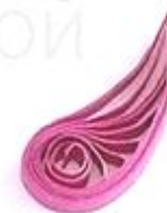
изогнутая капля (крыло, лепесток)