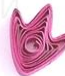
утиная лапка (птичья лапка)