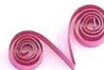
завиток в форме V