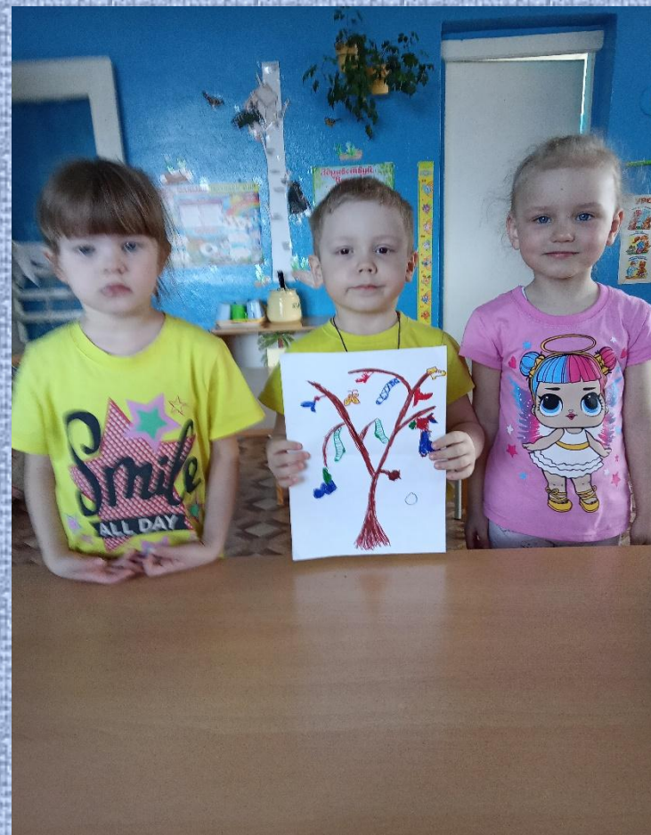
Рисовали чудо дерево.