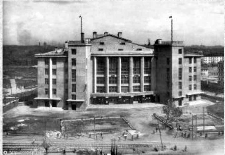
Д. К. им. Горького