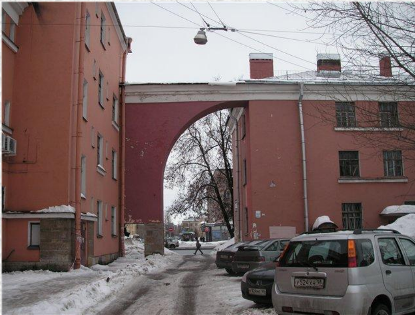
Жилые дома на Тракторной ул.