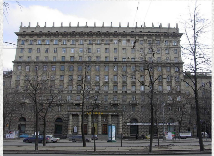
Московский пр., 202