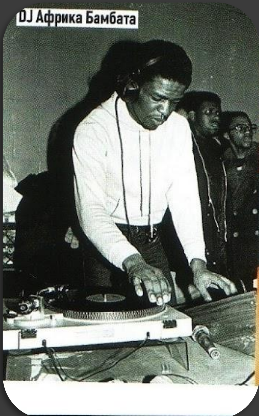
DJ Африка Бамбата