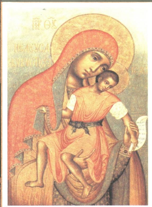
Симон Ушаков. Богоматерь Елеус-Киккская. Икона. 1668 г.