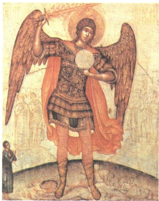
Симон Ушаков. Архангел Михаил, попирающий дьявола. Икона. 1676 г.