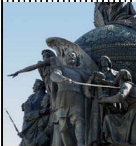
Дмитрий Пожарский на Памятнике «1000- летие России» в Великом Новгороде