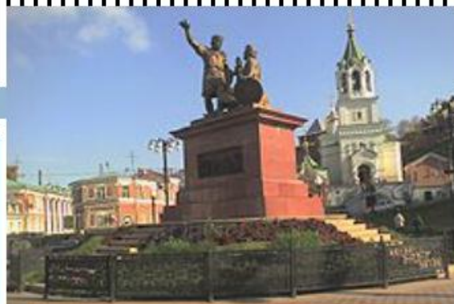
Памятник Минину и Пожарскому в Нижнем Новгороде