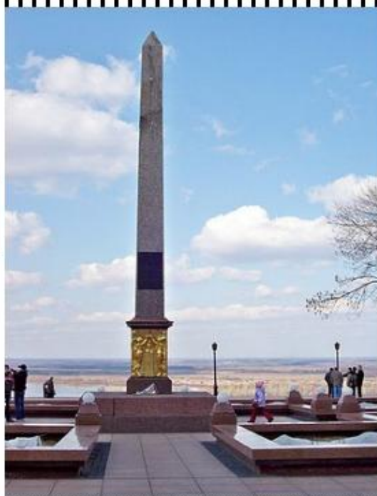
Обелиск в честь Минина и Пожарского в Нижнем Новгороде