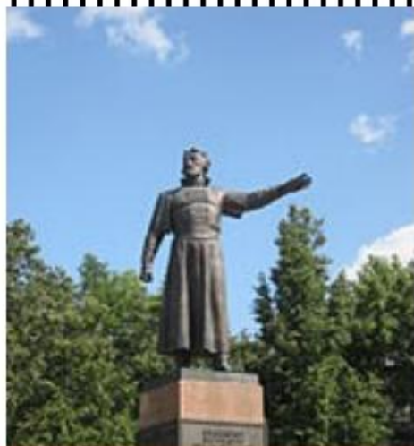
Памятник Кузьме Минину в Нижнем Новгороде