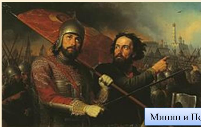
Минин и Пожарский

И не случайно, в связи с вышесказанным, что оплотом дальнейшей национально-освободительной борьбы русского народа за свою независимость и форпостом создания второго народного ополчения становится именно Нижний Новгород.