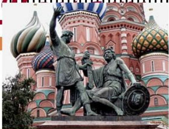
Памятник Минину и Пожарскому на Красной площади в Москве