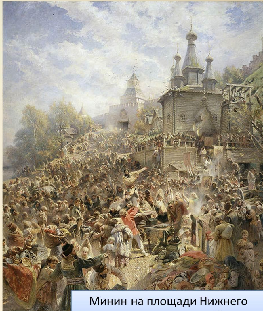
Минин на площади Нижнего Новгорода, призывающий народ к жертвованиям