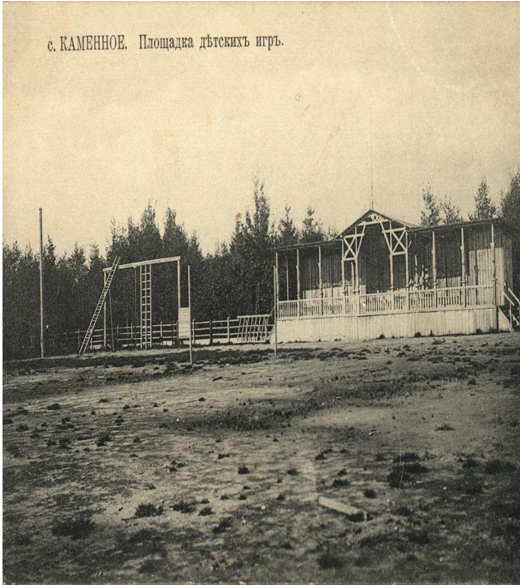
с. КАМЕННОЕ. Площадка дѣтскихъ игръ.