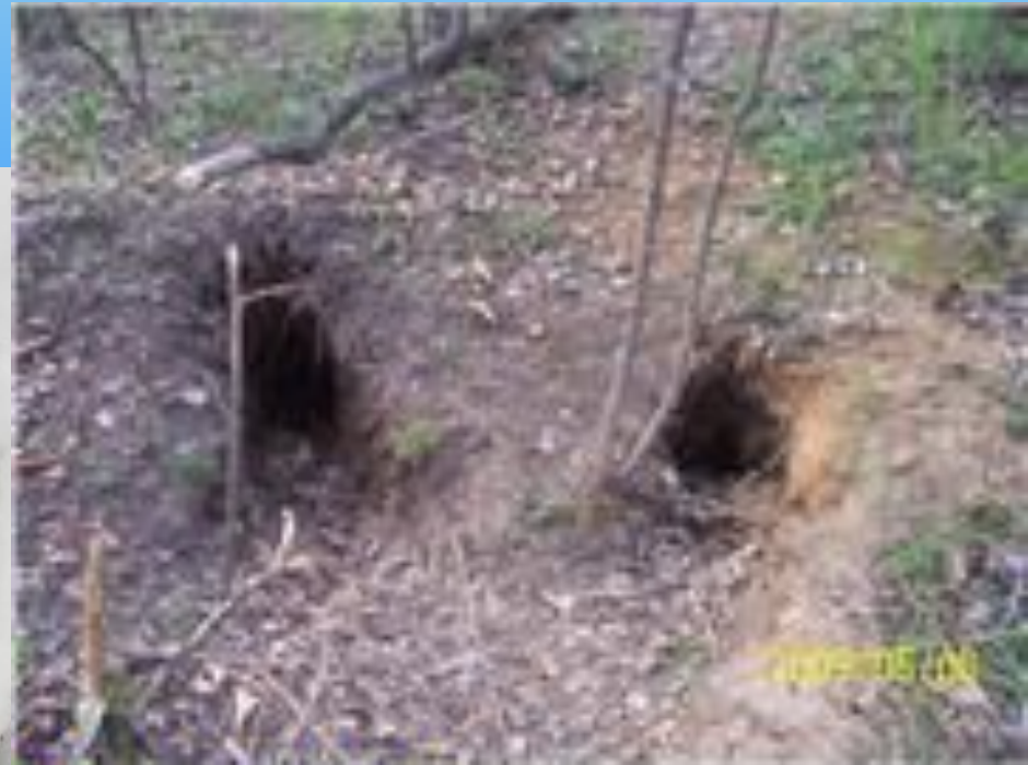
Здесь зимует барсук