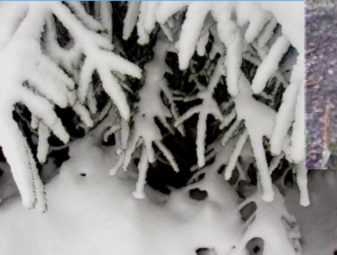
Спит медведь в своей берлоге