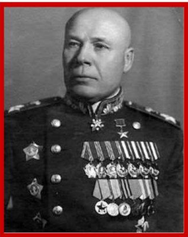
Семён Константинович Тимошенко - советский военачальник, командующий Западным фронтом в начале ВОВ