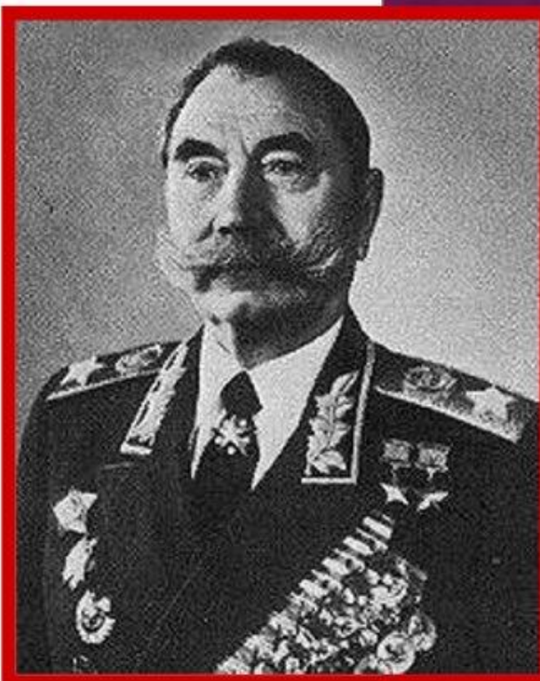
Семён Михайлович Буденный - советский военачальник, командующий Юго-Западным фронтом в начале ВОВ