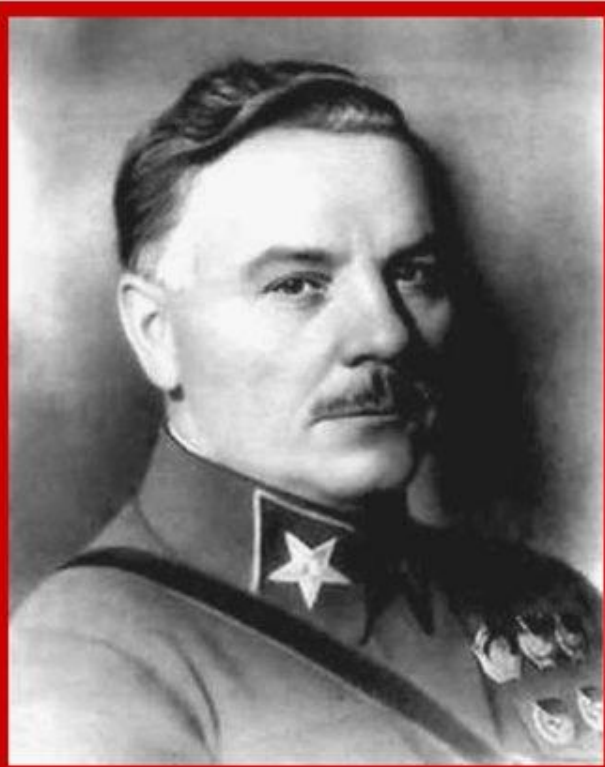
Климент Ефремович Ворошилов - советский военачальник, командующий Северо-Западным фронтом в начале ВОВ