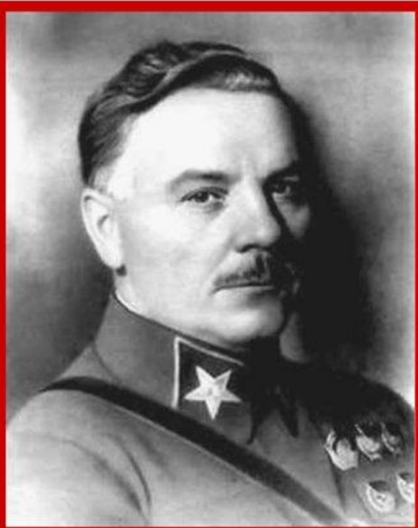
Климент Ефремович Ворошилов - советский военачальник, командующий Северо-Западным фронтом в начале ВОВ