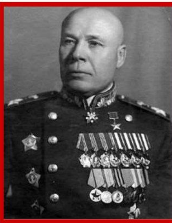
Семён Константинович Тимошенко - советский военачальник, командующий Западным фронтом в начале ВОВ