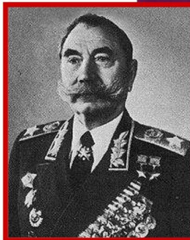
Семён Михайлович Буденный - советский военачальник, командующий Юго-Западным фронтом в начале ВОВ