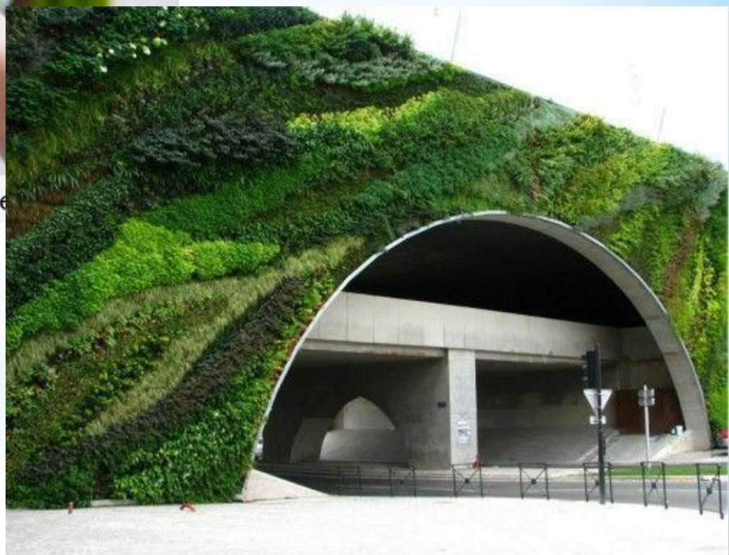
The Office Post