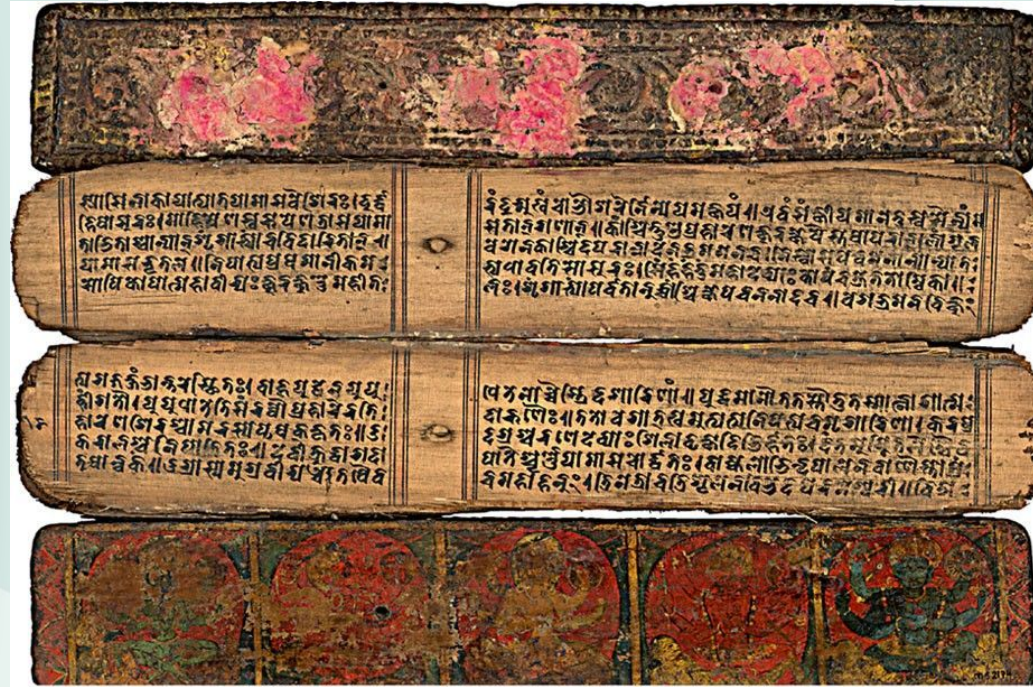
MS 2174 Devimahatmya, Praise of the great goddess. Bihar or Nepal, 11th c.