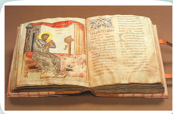
Первые книги в России