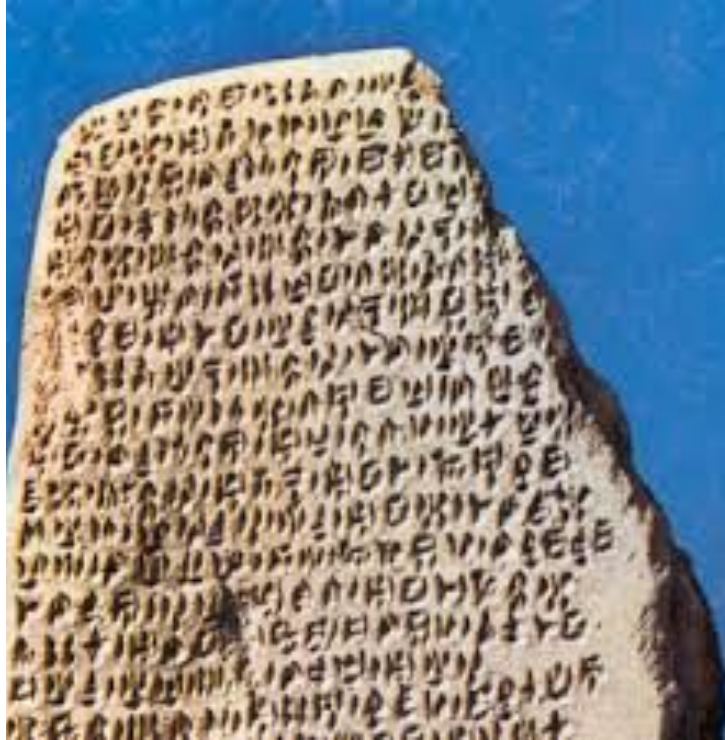
Письмо на камне