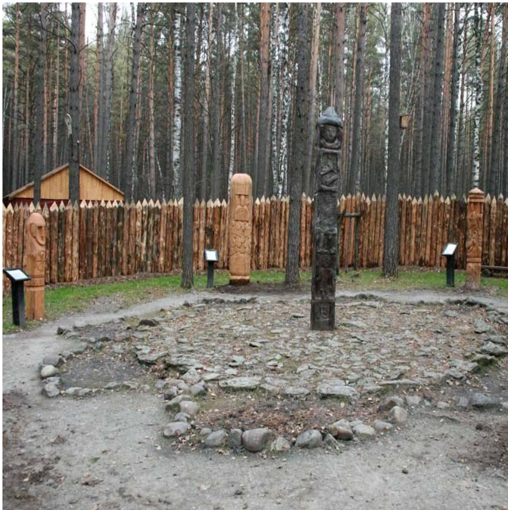
Капище и идолы древних славян Историко-культурный и природный музей- заповедник Томская писаница