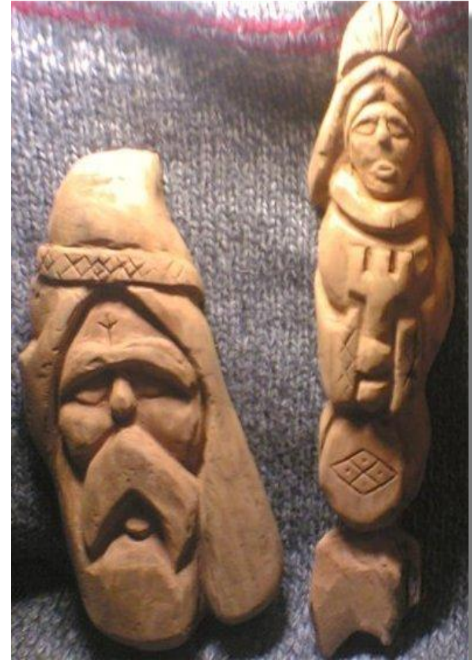
Славянские боги Сварог и Мокошь