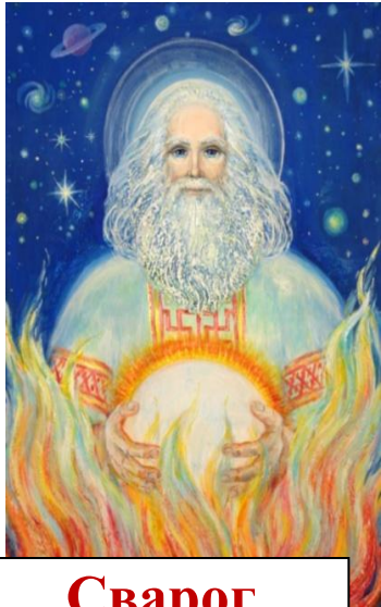
Сварог бог вселенной

ЯЗЫЧЕСТВО – вера в существование многих богов и духов (многобожие)