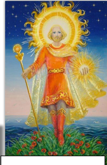
Ярило бог солнца