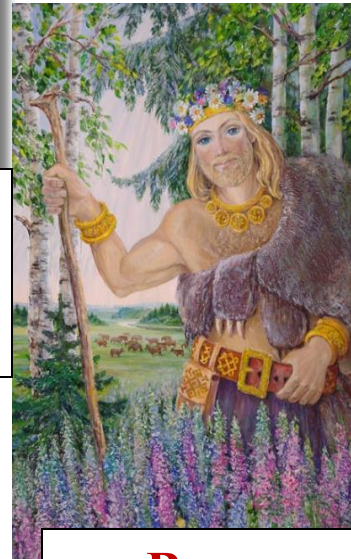
Велес покровитель скотоводства