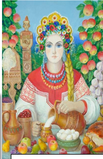
Мокошь божество плодородия