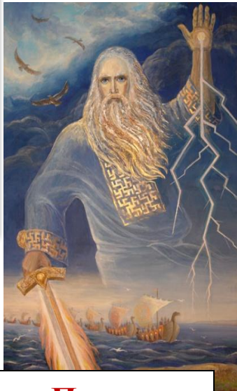
Перун бог грома и молний