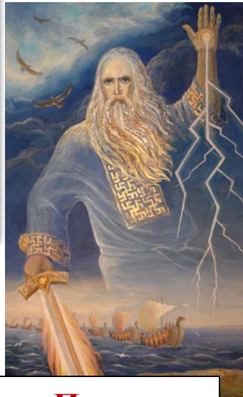
Перун бог грома и молний