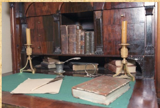
Стол, за которым работал Пушкин