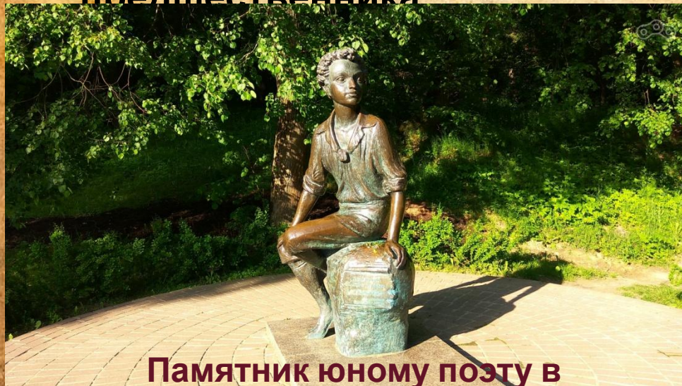
Памятник юному поэту в Захарове

В советское время дом использовался для разных нужд, некоторое время в нём располагалась школа.