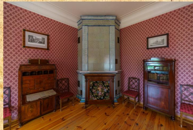
Интерьер главного дома