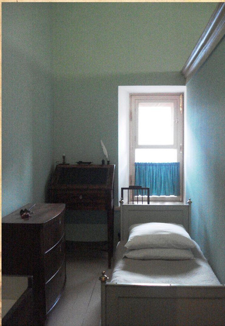
Комната № 14, в которой жил Пушкин