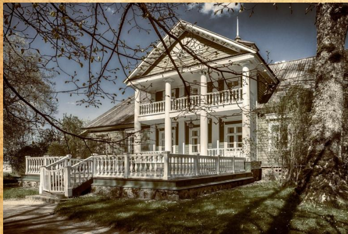
Главный усадебный дом