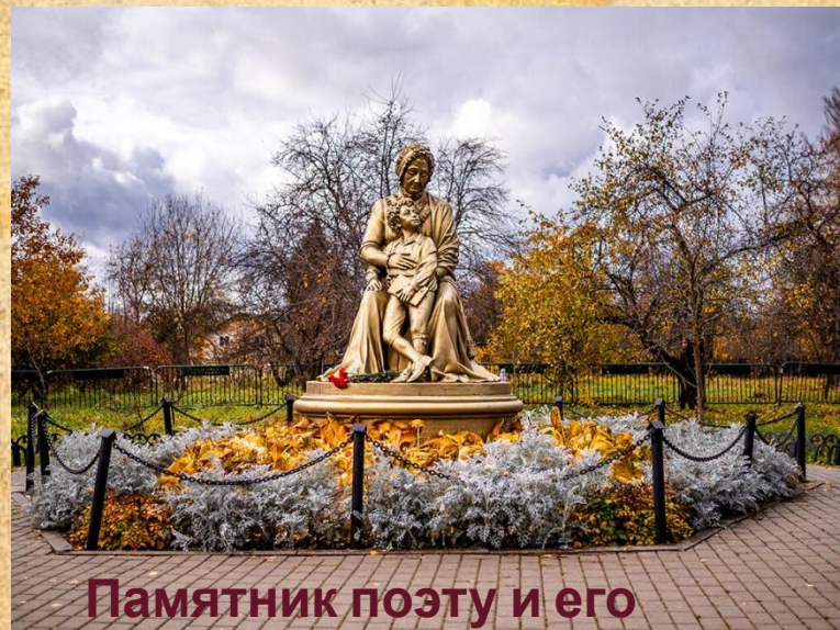
Памятник поэту и его бабушке