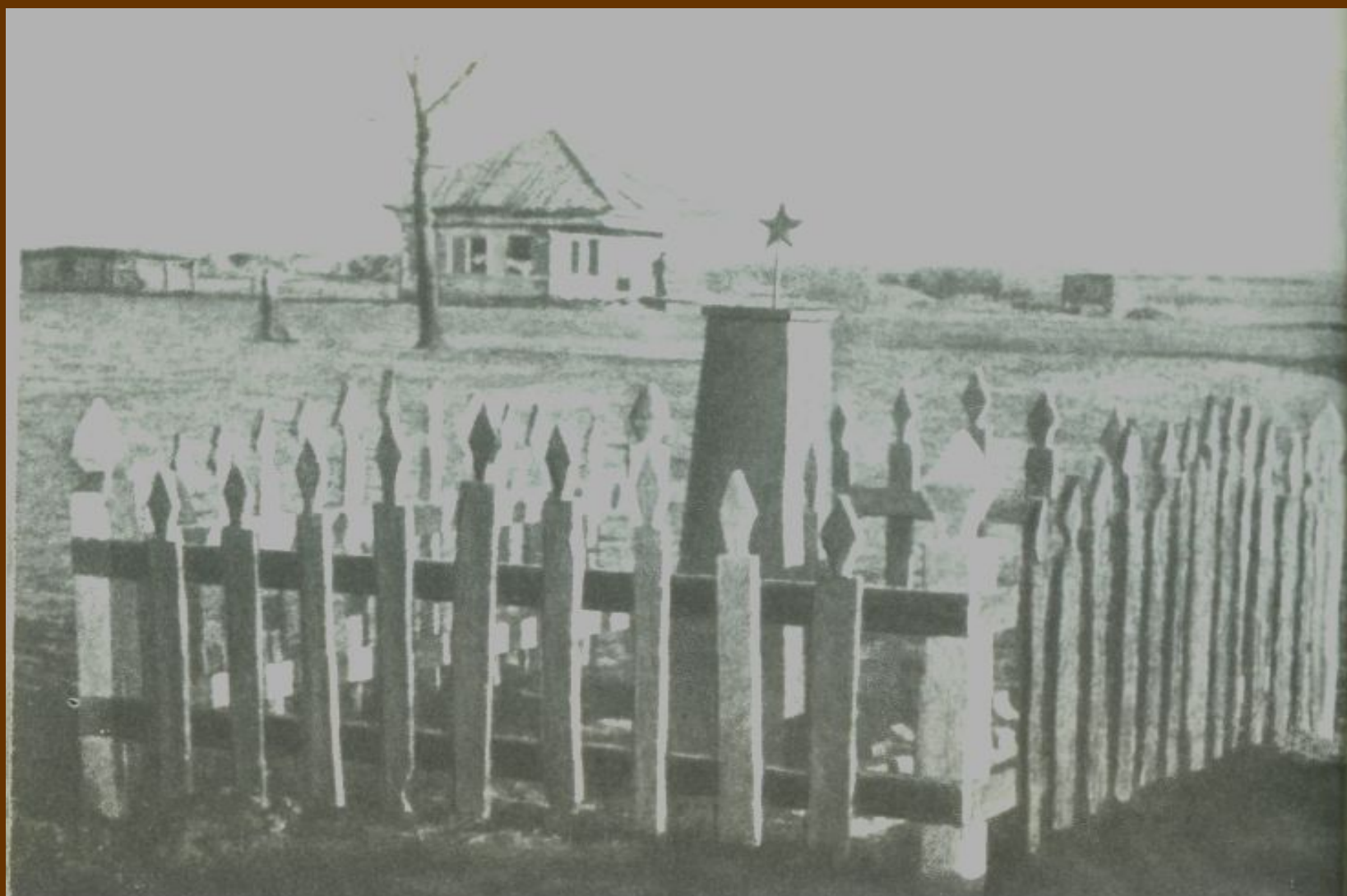
Могила Гули Королёвой