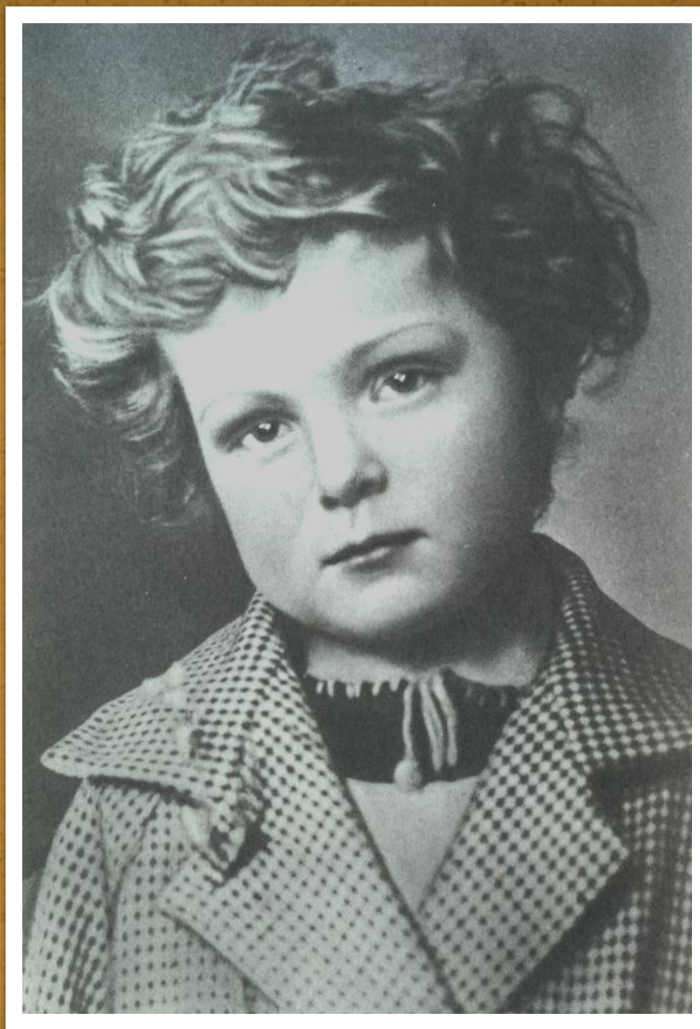
Гуле 4 года