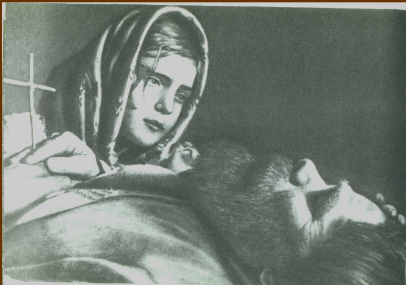
Гуля в роли Варьки. Кадр из фильма «Я люблю»