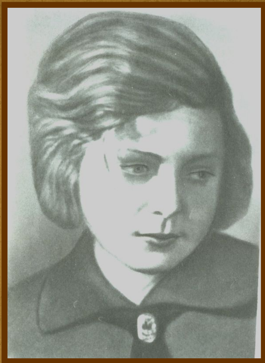
Гуле 14 лет