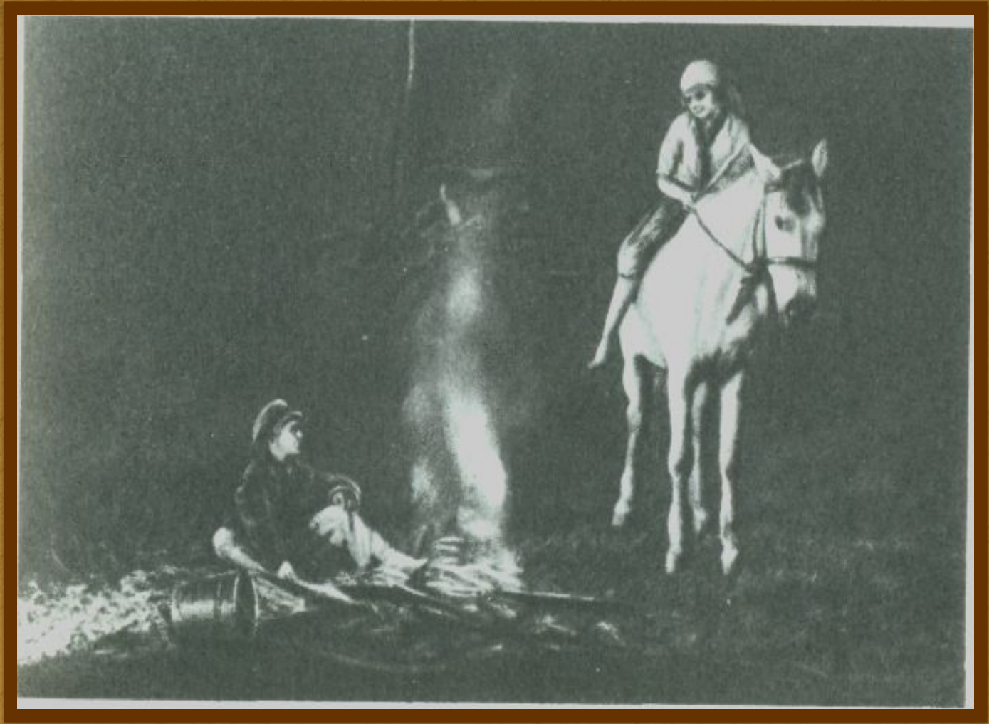
Кадр из фильма «Дочь партизана»