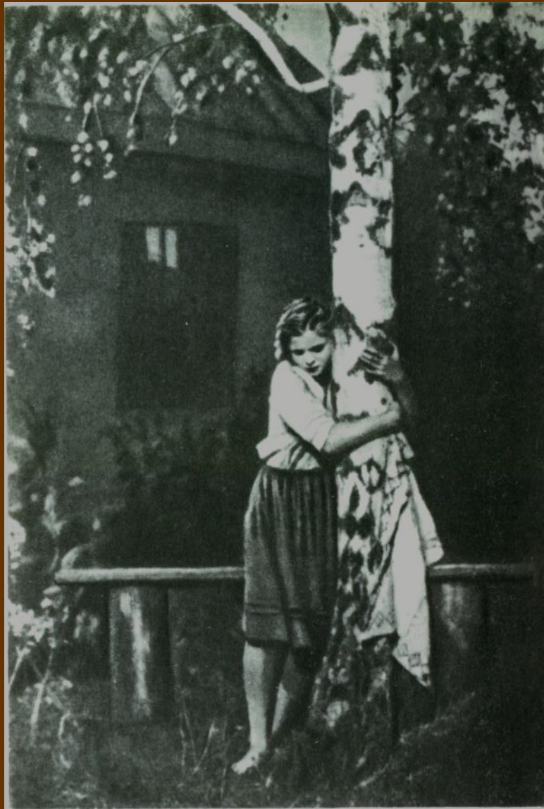
Василинка (Кадр из фильма «Дочь партизана»)