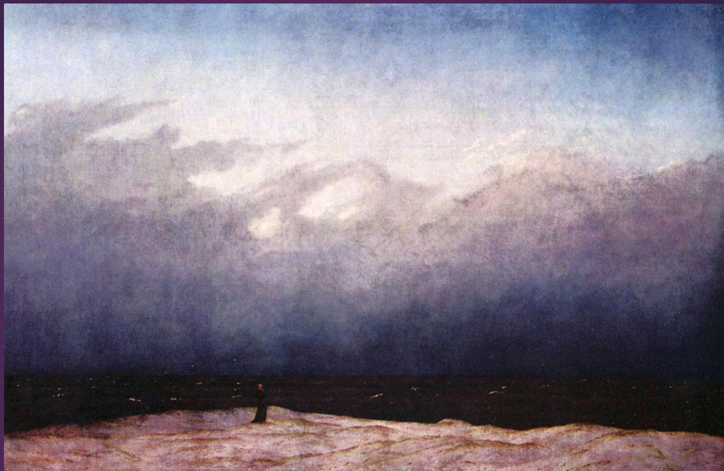
«Монах у моря»