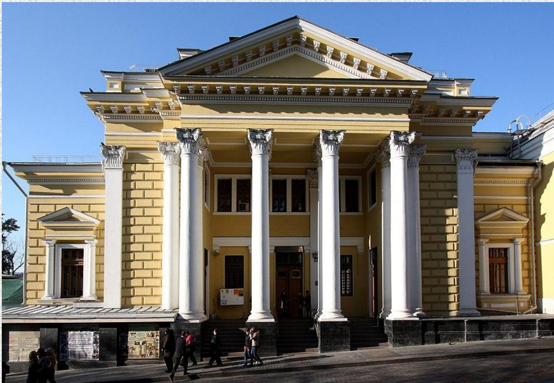
Синагога в Москве