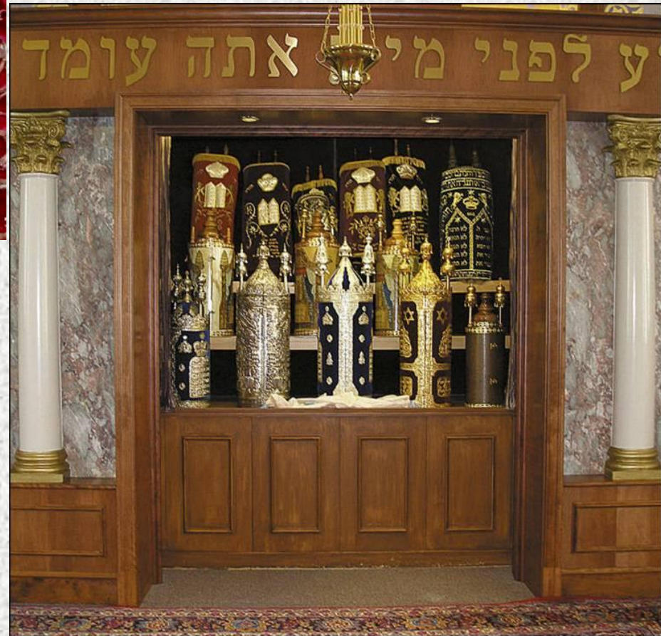
Шкаф, где хранится Тора