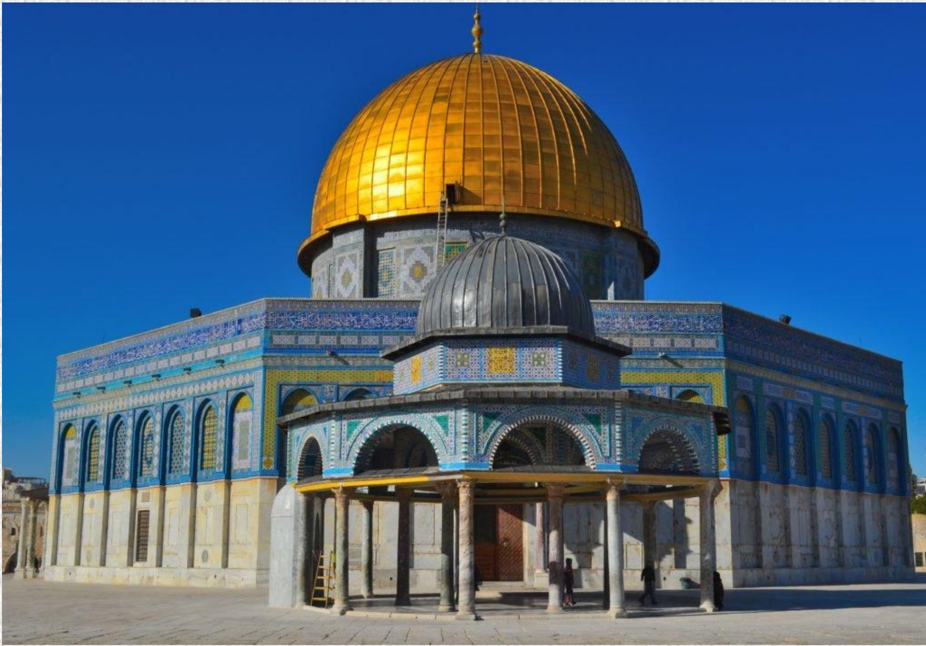
Синагога в Иерусалиме