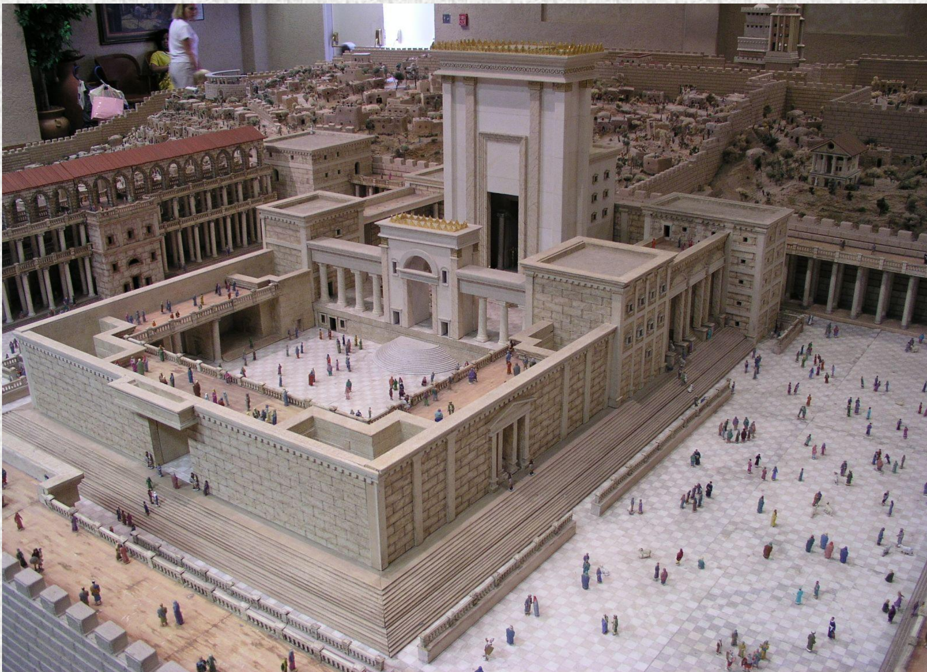
Макет Иерусалимского храма при царе