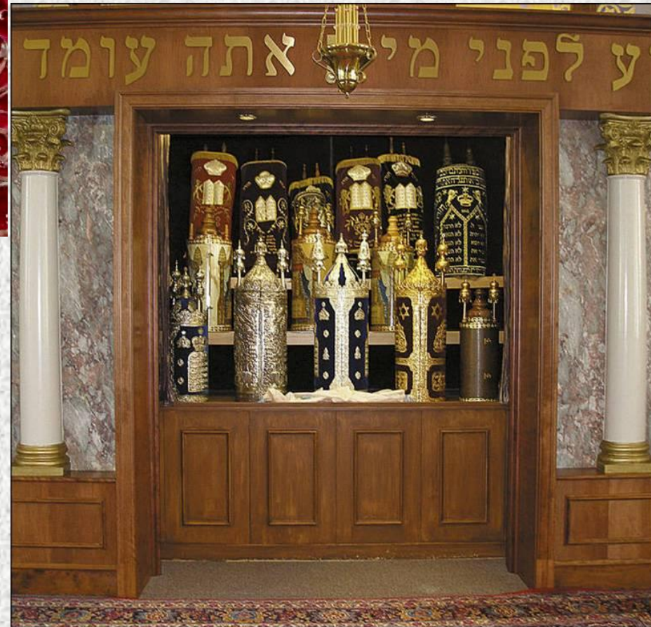
Шкаф, где хранится Тора