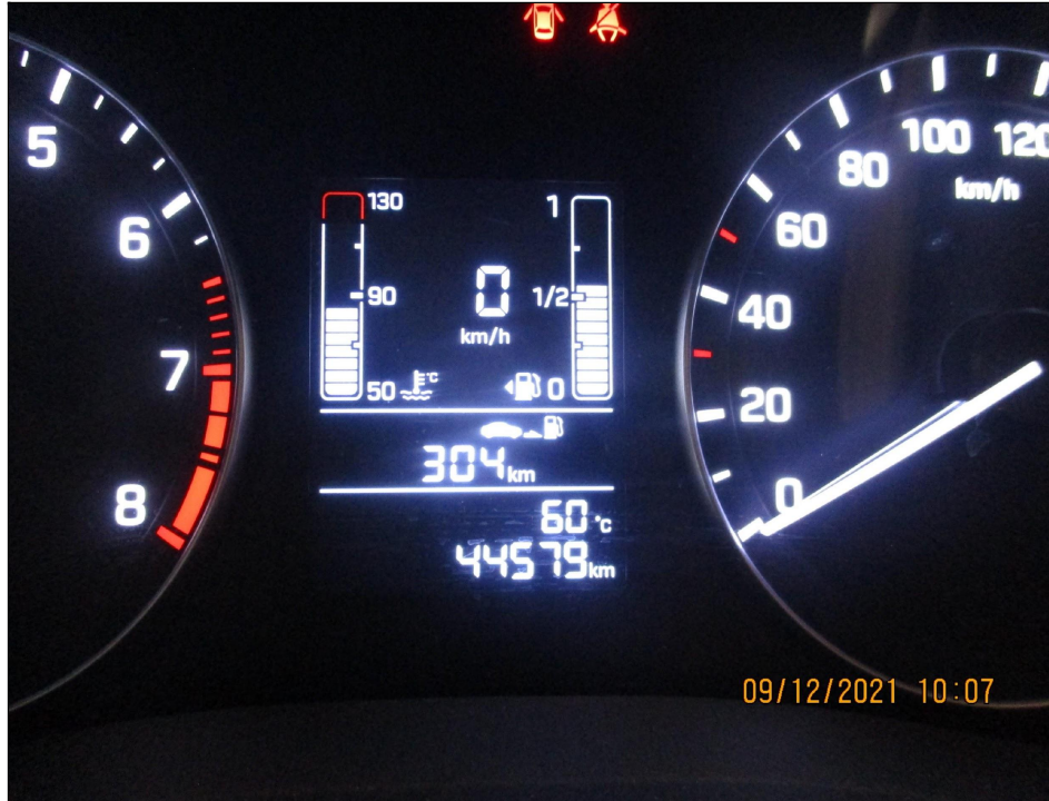
Вид проявления дефекта