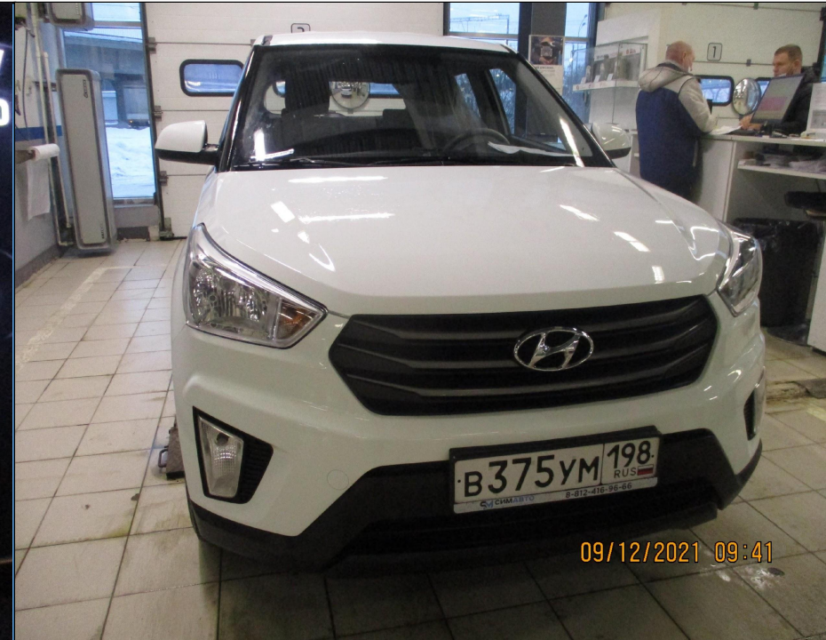
Внешний вид а\м